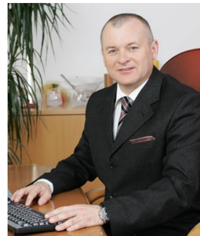
"Smo prva občina, ki uporabnikom zagotavlja brezplačni brezžični internet."

ta smo na treh lokacijah (Trg Svobode, Grajski trg in Glavni trg) že namestili tudi t.im. web kamere, s pomočjo katerih lahko obiskovalci prenovljene spletne strani Mestne občine Maribor (www.maribor.si) v živo (24 ur na dan) spremljajo dogajanje na omenjenih trgih (na navedeni spletni strani lahko najde tudi informacije glede brezplačnega brezžičnega interneta ter navodila za uporabo). V letu 2009 bomo kamere namestili še na območju Lenta, pri Studenški brvi in Koloseju ter na nekaterih drugih lokacijah.