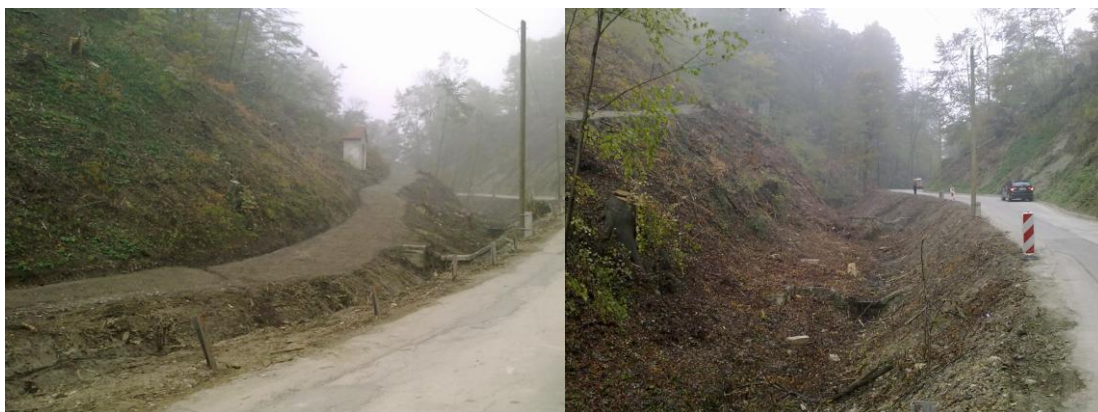
Slika 2; Obstoječe stanje

Lokalno je pobočje zelo nestabilno vsled globinskih vod, katere je potrebno drenirati.