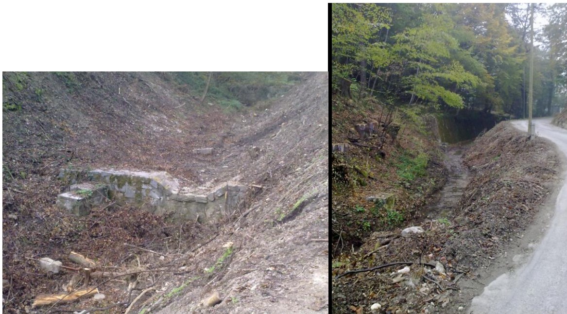
Slika 3; Obstoječe stanje