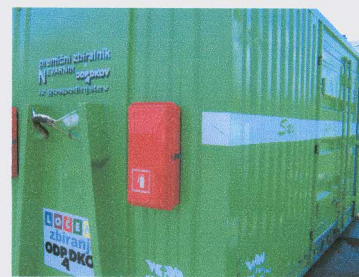
Premični zbiralnik nevarnih odpadkov