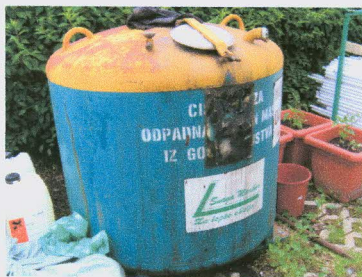
Posoda za olja