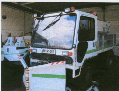
Delovni stroj s plugom in posipalnikom