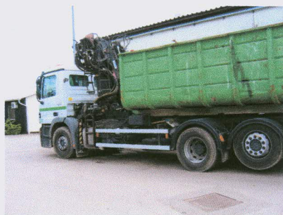
Namensko vozilo z dvigalom in navlečnim kontejnerjem