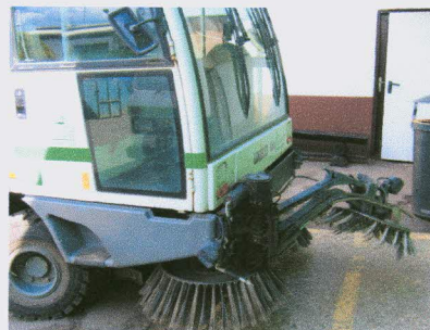
Delovni stroj za pometanje