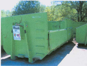
Navlečni kontejner s preklopno stranico

Za boljšo predstavbo so podane slike karakterističnih predstavnikov.