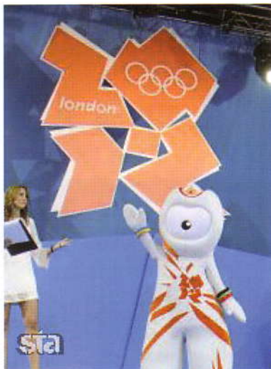
Maskota Wenlock ter logotip olimpijskih iger v Londonu 2012.

slovensko zastavo, osvojili kolajno. Skupaj jih imajo 21, od tega so jih šest osvojili na zimskih OI. Če gre verjeti tradiciji, bi lahko Slovenija že v Londonu prihodnje leto osvojila jubilejno dvajseto kolajno na letnih OI. Na vseh največjih igrah, kjer so nastopili slovenski športniki, pa so skupaj osvojili 49 kolajn, od tega 21 v samostojni Sloveniji, 16 pred osamosvojitvijo Slovenije, še 12 pa so jih osvojili v ekipnih športih. To pomeni, da bo naslednji športnik, ki si bo okrog vratu nadel olimpijsko kolajno, zapisan v slovensko športno zgodovino z zlatimi črkami, saj bo športnik s 50. slovensko kolajno na OI.