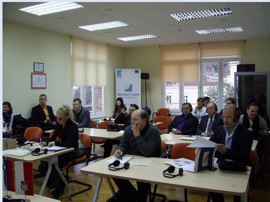
Slika: Tretji FunReg dogodek v Reki

medobčinski projekt Mikro turistične destinacije podeželja - MIKROTUR in predstavitev delovanja komunalne direkcije na področju cestne infrastrukture.