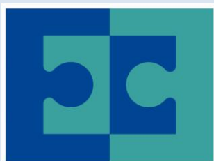
Regionalmanagement Graz & Graz-Umgebung