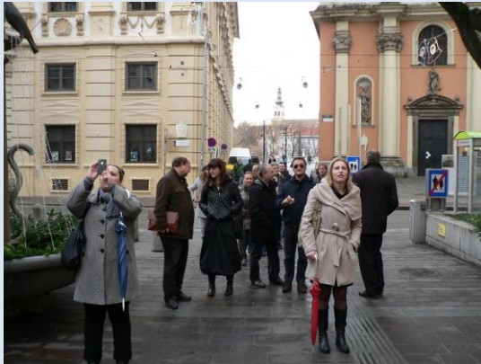
Slika: Ureditev trgov v centru Gradca