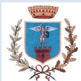
COMUNE di Mosciano Sant'Angelo