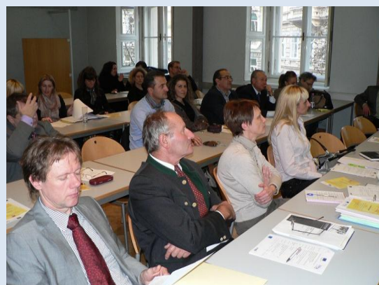
Slika: Drugi FunReg dogodek v Gradcu

Naslednji dan 29. novembra je bil organiziran študijski obisk. Ogledali smo si tri primera dobrih praks projektov v Gradcu in okolici, ki so bili prejšnji dan teme predstavitve, in sicer: