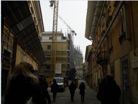
Slika: L'Aquila, obnova mesta