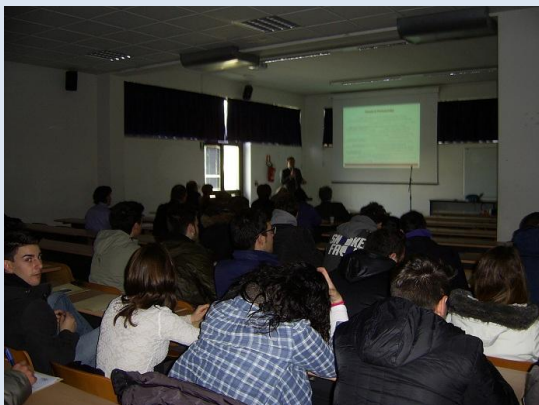
Slika: Četrty FunReg dogodek v Mosciano

Prvi dan dogodka nas je pozdravil župan mesta Mosciano Sant Angelo, rektor Univerze v Teramu in direktor Sejemskega centra. Nato so se začele predstavitve stanovanjske izgradnje na območju funkcionalne regije občine Mosciano Sant Angelo. Predstavniki regije Abruzzo je predstavil regionalno stanovanjsko politiko in projekte, ki jih je občina izvedla v zadnjih letih. Sledila je predstavitev podjetja Ater – območne stanovanjske agencije, ki sodeluje z občino pri načrtovanju in izgradnji novih stanovanj. Predstavili so njihovo vlogo, dejavnosti in projekte. Nato so sledile predstavitve lokalnih podjetnikov, ki so predstavili primere dobrih praks stanovanjske gradnje. Vsi so poudarjali specifično protipotresno izgradnjo, saj so morali po rušilnem potresu leta 2009, ki je močno prizadela njihovo regijo, prilagoditi zakonodajo in prakso izgradnje objektov, ki morajo biti grajeni protipotresno.