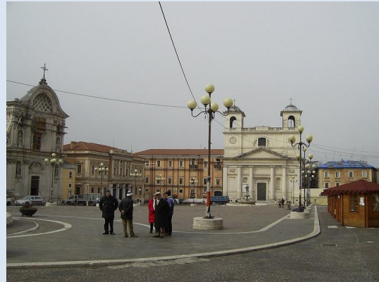
Slika: L'Aquila, obnova mesta

Tretji dan dogodka smo namenili študijskemu obisku. Gostitelji so nas odpeljali do mesta L'Aquila. Mesto je bilo močno porušeno v potresu leta 2009. Staro mestno središče je prazno, saj zaradi močnih poškodb objektov ni primerno za bivanje. Skupaj s predstavniki občine L'Aquila smo si ogledali staro mestno jedro, potek obnove stanovanj po potresu leta 2009 in novo zgrajena naselja izven mestnega jedra, kamor so preselili prizadete prebivalce.