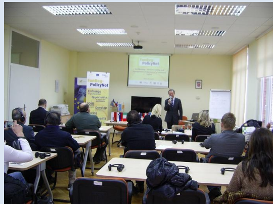
Slika: Tretji FunReg dogodek v Reki

Projektne partnerji iz Italije, Občina Mosciano Sant Angelo je predstavila načine samouprave na nivoju regije, province in občine. Člen 114. Ustave v sedanji obliki, je uvedel reforme leta 2001, ki določajo da je Republika sestavljena iz občin, provinc, metropolitanskih mesta, regije in države. To je sistem, ki temelji na več ravneh vlade. Regije, pokrajine, mesta in mestne občine so lokalne vlade, saj opravljajo naloge vlade na tem področju in imajo moč vlade nad državljani. Pokrajine in občine so pogosto označena kot lokalnih oblasti. Regije, pokrajine in mesta so tudi avtonomni subjekti. Njihova avtonomija izhaja iz dejstva, da so demokratični organi: njihove organe odločanja neposredno izvolijo državljani s stalnim prebivališčem na njihovem ozemlju. Zato so instrumenti samouprave posameznih regionalnih in lokalnih skupnosti.