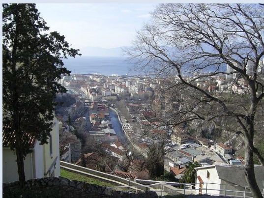
Slika: Pogled na Reko iz Trsata

Tretji dan dogodka je bil namenjen študijskemu obisku projektov funkcionalne regije občine Reka. Gostitelji so nam pokazali nekatere športne in turistične kapacitete ter kulturno infrastrukturo.