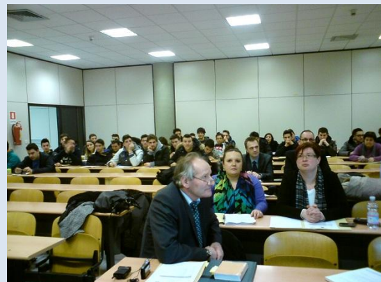
Slika: Četrty FunReg dogodek v Mosciano