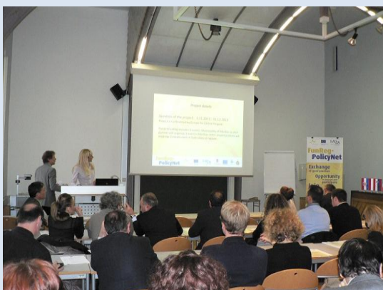
Slika: Drugi FunReg dogodek v Gradcu

Okrogla miza (Panel 2) je bila osredotočena na vsebinsko zasnovo projektne naloge. Vodilni partner je predstavil načrt nadaljnjih aktivnosti (potek naslednjih dogodkov) in projektne ideje. Govorili smo tudi o spremembah v okviru projekta FunReg-PolicyNet, o finančnem delu projekta, usklajevali termine posameznih dogodkov, ipd.