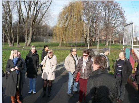
Slika: Ureditev okolice primestne četrti

Dogodka se je skupaj udeležilo okoli 110 udeležencev.