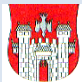
Mestna občina Maribor