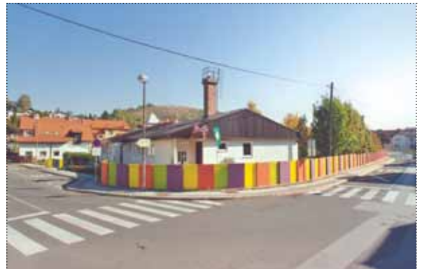
Okoli 120 m dolga, domiselno pobarvana ograja, ni v okras samo vrtcu, ampak vsej okolici