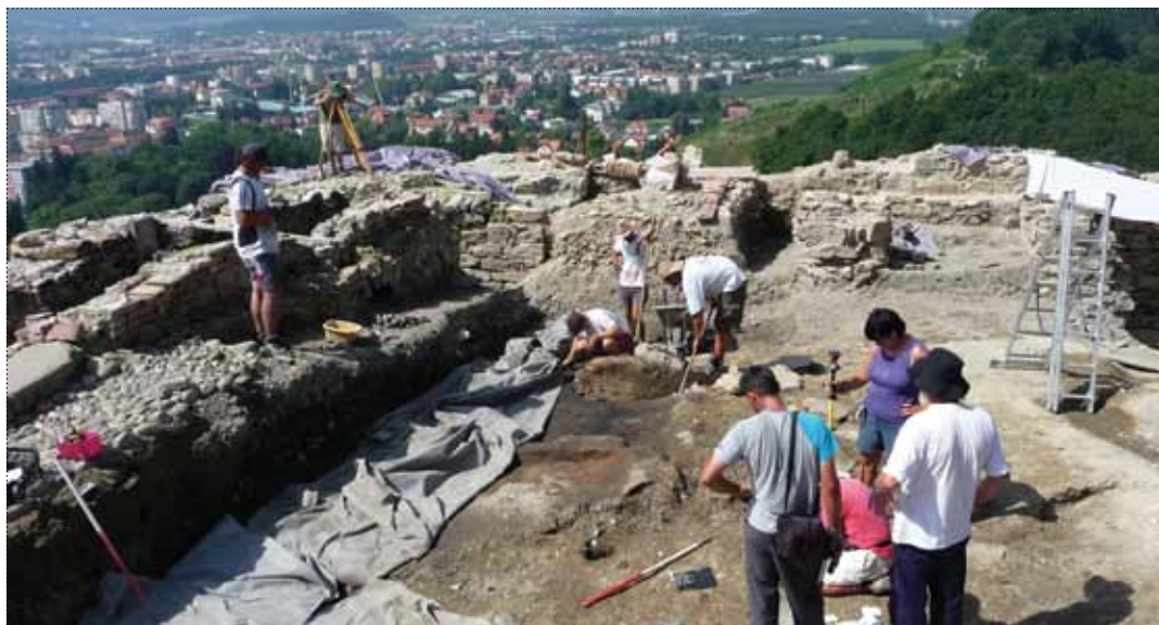
Med arheološkim izkopavanjem

Grad je v svoji prvotni vlogi odigral pomembno obrambno funkcijo pred madžarskimi vpadi, a je že v naslednjih stoletjih dokaj hitro začel izgubljati svoj varovalni namen. Zaradi požarov, turških obleganj in dotrajanosti objekta pa je izgubil tudi bivanjsko sposobnost, tako da so ga v 18. st. popolnoma opustili in kasneje porušili. Na njegovo mesto so postavili spominsko kamnito piramido, po kateri je hrib nato dobil ime. Do nedavnega nas je na