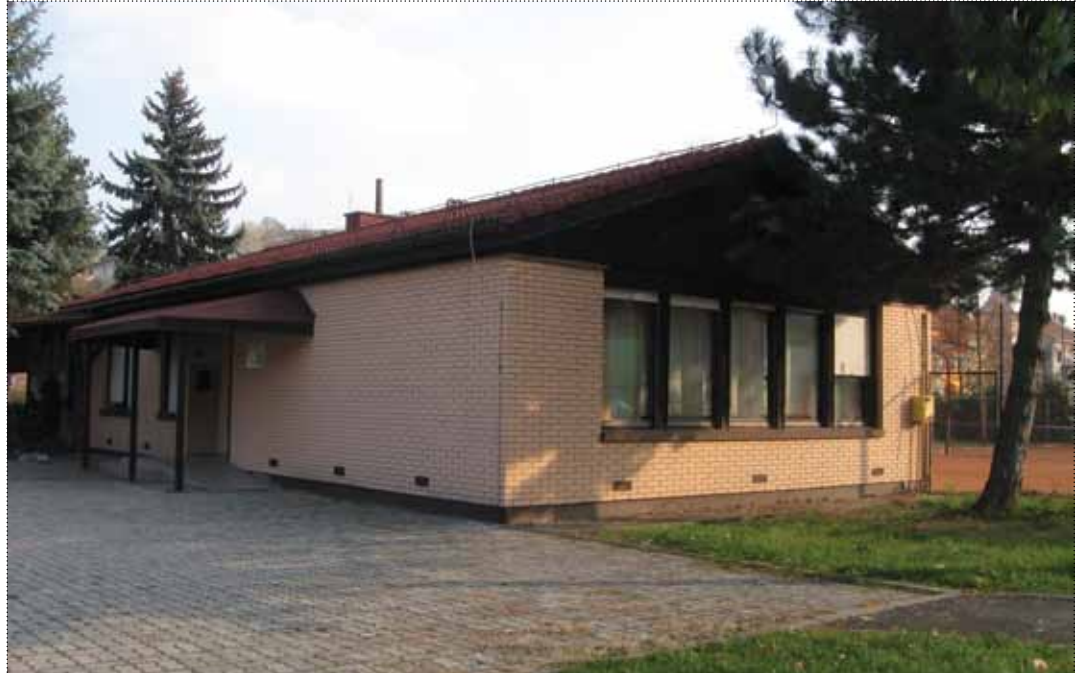
Naj se v dom vrne življenje

Mestna četrt je bila v tistem času primorana oddati celoten dom v najem, saj drugače ni mogla zagotoviti rednega vzdrževanja stavbe. Posledica tega je bila, da smo morali prestaviti tudi volišče (v podružnično šolo Košaki). Dejavnosti krajanov so zamrle in tekom let zanje tudi ni bilo več zanimanja.