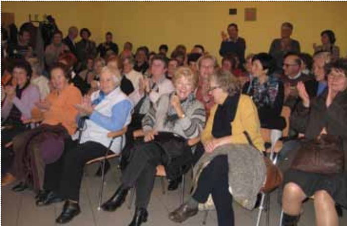
Dvorana doma je »pokala po šivih«