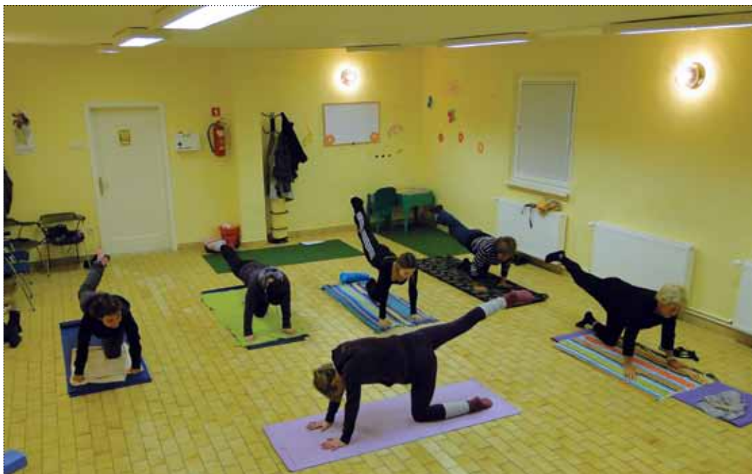
Tečajnice v akciji

pridobila certifikat Evropske joga zveze za strokovno vaditeljico. Skupina deluje že eno leto. Starostne omejitve za udeležence ni, kar dokazuje skupina, v kateri so udeležence stare od 25 do 70 let. Vse tečajnice so ob prvem obisku dobile vprašalnik o zdravstvenem stanju, kar je vaditeljici v pomoč pri načrtovanju programa vaj.