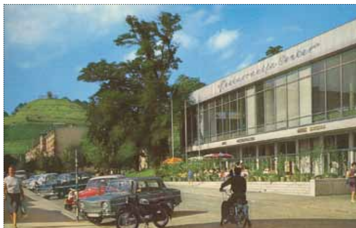
Restavracija Center okoli 1960

Zgornji plato garažne hiše bo v nivoju Prešernove ulice in bo obsegal 2.500 m 2 . Na njem bo možno pripraviti npr. tržnico, drsališče, javne prireditve z malim odrom in podobno. V ta namen že iščejo upravljalca tega večnamenskega prostora.