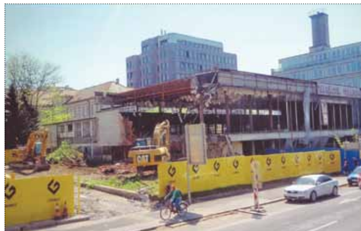
Od rušenja do novega objekta je minilo le pol leta

Računajo, da bi tako ostalo nekaj let oz. do gradnje druge faze. Ta je vezana na soglasje države oz. Univerze v Mariboru, kar bi potrebovali za izgradnjo dodatnih 120 parkirnih prostorov in drugega. Vse aktivnosti pa so povezane tudi s tem, da je bila Restavracija Center pod spomeniškim varstvom.