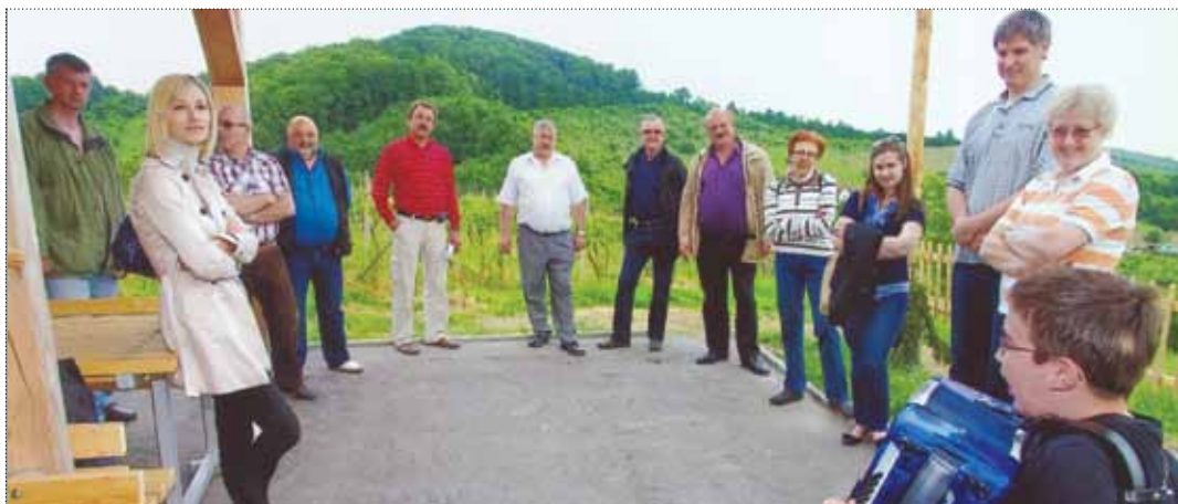
Počehovčani so članom sveta pripravili tudi krajši kulturni program

drič, Ivan Cankar in Heroj Tone Tomšič) ter članom sveta predstavila problematiko, s katero se