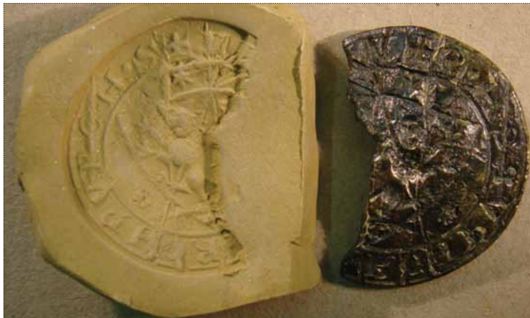
Pečatnik – odtis in original

Razvoj sodobnega Maribora je neizpodbitno vezan na posamezne dogodke, socialna gibanja in ljudi, ki so v našem mestu živeli in ga oblikovali. Pogosto zanemaren element v prostoru so arhitekturne in ostale oblike nepremične kulturne dediščine, ki so v določenem obdobju odigrale pomembno vlogo, danes pa nam nudijo širši vpogled v določen čas in občutek pripadnosti kontinuiteti mesta, kjer živimo. Rodovitna pokrajina in obramba Slovenskih Goric, Kozjaka in Pohor-