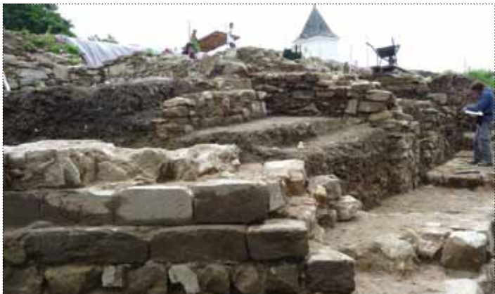
Pogled na obodni zid gradu

grad spominjala le še Marijina kapela, sredi osemdesetih let prejšnjega stoletja pa je dala Občina Maribor pobudo, da se začnejo arheološka izkopavanja, ki bi dokazala obstoj gradu, mu dala novo vsebino in turistični potencial. Sondiranja so pokazala pozitivne rezultate in določila nove smernice in težnje, da občina in država le najdeta posluš za odkritje in prezentiranje mariborskega prvotnega gradu. Z izkopavanji na gradu v letih 2010 in 2011 smo dobili vpogled v vsebino in stratigrafijo kulturnih plasti ter strukturo in potrebno izpovednost arheoloških grajskih ostalin na zahodnem delu objekta. Prvotna trdnjava je stala na starih kulturnih tleh, saj so izkopavanja na tem mestu dokazala prazgodovinske in poznoantične poselitvene strukture, ki se znatno dopolnjujejo z arheološko podobo mariborskega okoliša. Temelji nekdanjih grajskih pozidav izvirajo iz visokosrednjeveške, srednjeveške in novoveške faze grajskega razvoja, pri čemer moramo izpostaviti značilno štirikotno za-