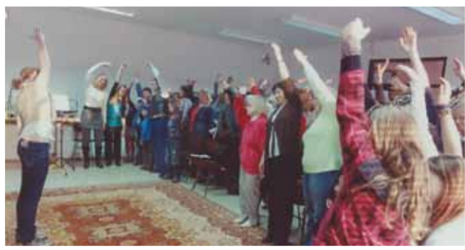
Zanimanje za vaje joge je bilo veliko