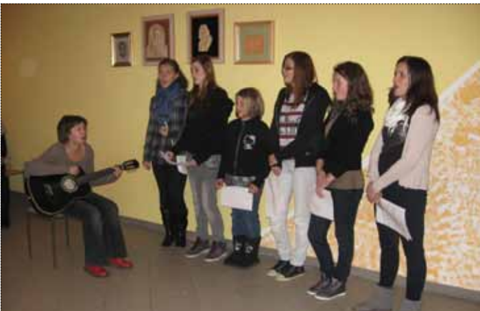
Zapel je tudi zborček Slomškov glasek iz naše MČ

Življenje ubira svoja pota in naneslo je, da je dosedanji najemnik odpovedal najem dela prostorov doma – del, v katerem je nekoč delovala KS Krčevina.