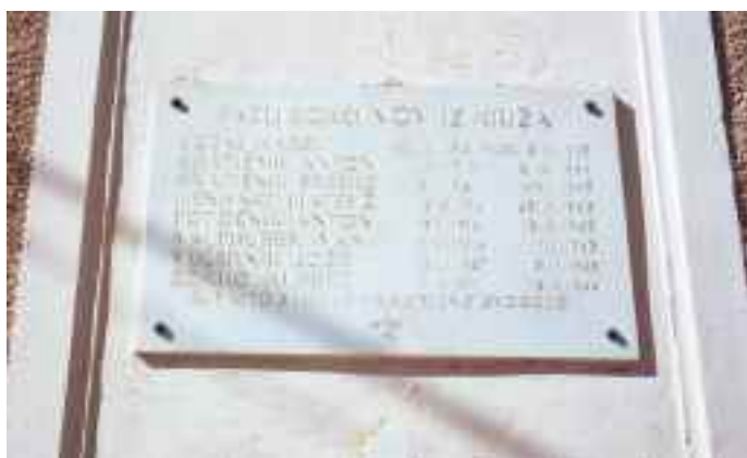
Spomska plošča padlim borcem NOB iz Križa na šolski zgradbi, Šober 1