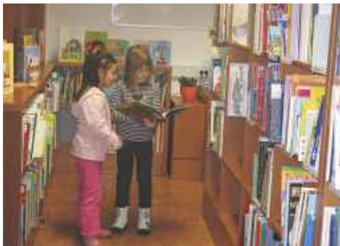
Novi prostori Knjižnice Kamnica od leta 2009

storna knjižnica, ki nudi vse možnosti za izvajanje prireditvev za otroke in odrasle. Knjižnica sedaj omogoča najširši dostop do knjižnega gradiva, krajanom pa kulturno udejstvovanje in prijetno izpolnjevanje prostega časa. Storitve knjižnice so namenjene vsakomur. Najmlajši si lahko izposodijo kvalitetne slikanice, šolarji in dijaki priročnike za pomoč pri izdelavi referatov in seminarskih nalog, študentje najdejo veliko strokovnih knjig za pomoč pri študiju, vsi pa mnogo zanimivega, poučnega in razvedrilnega branja.