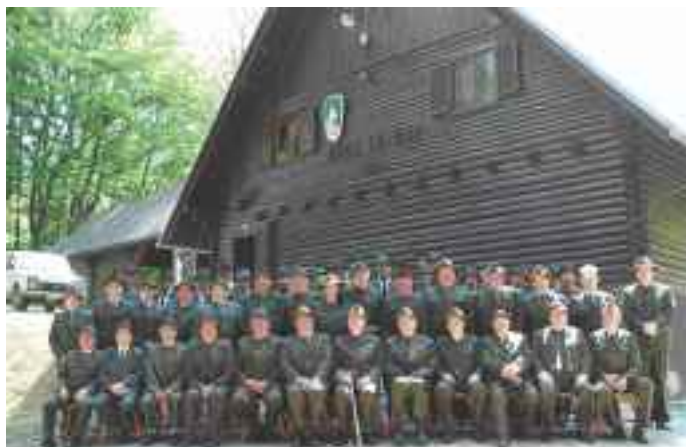
Lovci LD Gaj nad Mariborom pred lovskim domom

V prihodnosti nas čaka veliko izzivov. Vendar bomo za uresničevanje načrtov potrebovali mlade ambiciozne ljudi, ki bodo za ohranjanje narave pripravljeni žrtvovati svoj prosti čas. V ta namen lovci obiskujemo tudi vrtnice in šole, kjer mladim predstavimo svoje naloge. Vabljeni med člane zelene bratovščine!