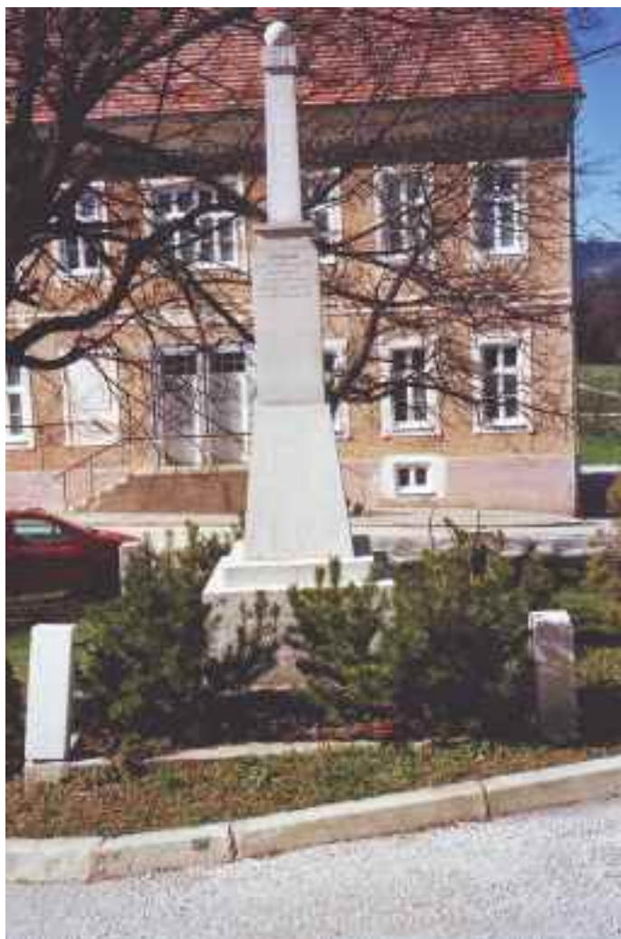
Spomenik padlim v 1. svetovno vojni na Gaju (v ospredju) in spominska plošča padlim borcem NOB na šolski zgradbi (v ozadju)

PRIKAZUJEMO VAM SPOMINSKA OBELEŽJA V KRAJEVNI SKUPNOSTI BRESTERNICA-GAJ