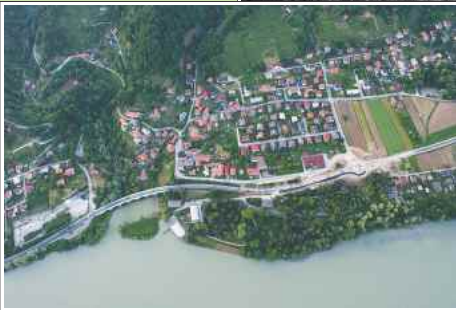
BRESTERNICA IZPOD NEBA, 2009