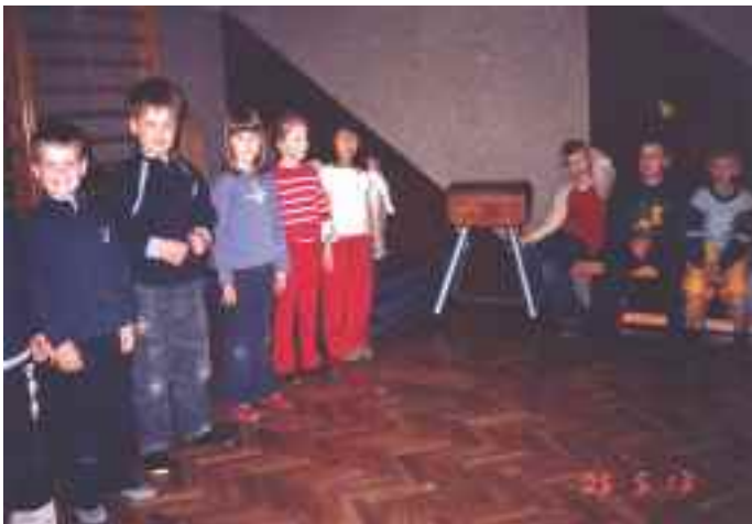
Otroci, učenci OŠ Kamnica - podružnica Bresternica pred sprejetjem v podmladek RK

Vsako leto ob tednu Rdečega križa, med 8. in 15. majem, sprejmemo v članstvo podmladek. To so učenci Osnovne šole Kamnica - podružnica Bresternica. Ob tej priliki jim podarimo slikanice o Rdečem križu, praktična darila ter jih skromno pogostimo. V tem času zbiramo tudi oblačila, jih delno razdelimo našim krajanom, ostalo pa odpeljemo v humanitarno skladišče Območnega združenja Rdečega križa Maribor.