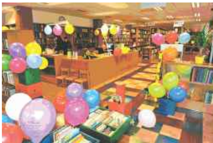
Knjižnica Kamnica na dan otvoritve