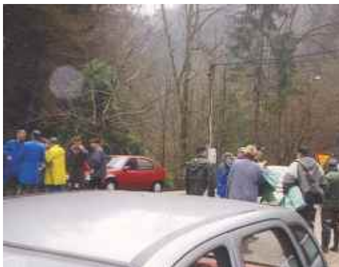
Čistilna akcija – Šober Dvor.

V prihodnosti nas čaka veliko izzivov. Vendar bomo za uresničevanje načrtov potrebovali mlade ambiciozne ljudi, ki bodo za ohranjanje narave pripravljeni žrtvovati svoj prosti čas. V ta namen lovci obiskujemo tudi vrtnice in šole, kjer mladim predstavimo svoje naloge. Vabljeni med člane zelene bratovščine!