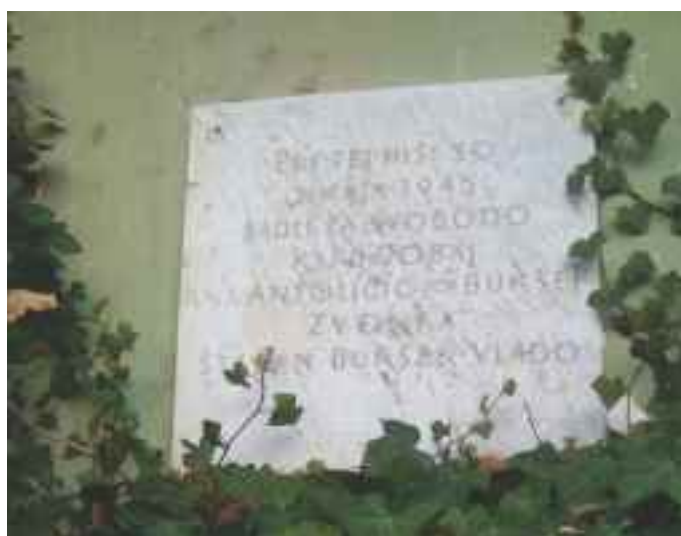
Spominsko obeležje padlim za svobodo na hiši Gaj nad Mariborom 65