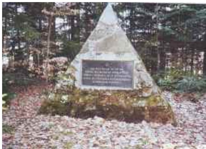
Poslednje srečanje aktivistov NOB na Tojzlovem vrhu