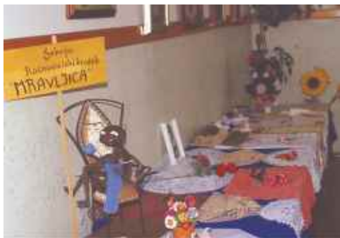
Delček vsakoletne razstave

Vsakoletnega občnega zbora se udeleži tudi do 300 naših članov. Pripravimo jim program, po njem pa ob zakuski tudi zaplešejo. Občne zборе smo pred leti imeli v Domu krajanov v Bresternici. Ker je dvorana postala pretesna se sedaj odvijajo v Osnovni šoli v Kamnici ali v šotoru ob krajevnem prazniku Kamnice.