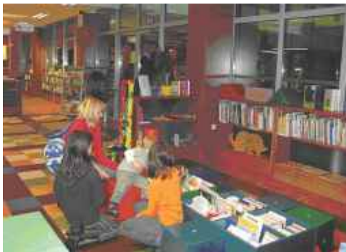
Knjižnica Kamnica nudi pester izbor gradiva