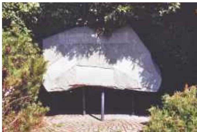
Spomenik padlim borcem NOB pred Domom krajanov v Bresternici