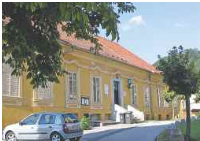
Knjižnica Kamnica na Kamniški grabi 2 od leta 1978 do leta 2009