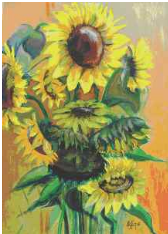
Nada Štafunko: Son•nice, 2008, akril na papirju