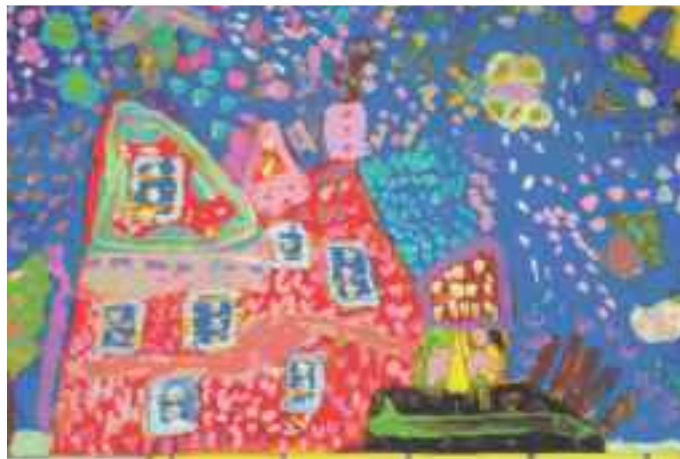
Moj vrtec, Katja in Eva, 5 let

Letos praznuje naš vrtec že 50. rojstni dan.