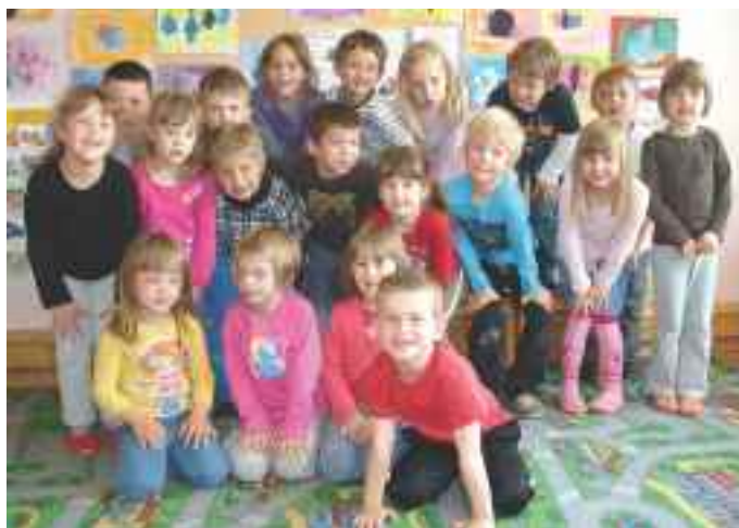
Otroci skupine Lunino kraljestvo

V vrtcu poskušamo s pestro ponudbo različnih programov zadovoljiti potrebe otrok in staršev. Pri tem nam pomagajo starši, vodstvo vrtca in lokalna skupnost.