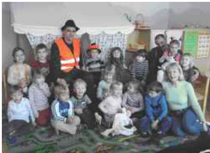
Lovci na obisku v vrtcu.

Vloga lovca se je v zgodovini zelo spreminjala. V času podnebnih sprememb, ogrožanja našega zelenega planeta vidimo lovci svoje poslanstvo v ohranjanju narave in življenjske raznovrstnosti. V današnjem času, lov predstavlja le eno izmed nalog lovca, večino časa pa namenjamo delu v naravi, kjer pripomoremo k izboljšanju življenjskih razmer za vsa živa bitja. Občani krajevne skupnosti lovce opazijo predvsem pri čistilni akciji, vendar čez leto čistimo tudi stare sadovnjake, izdelujemo ptičje gnezdilnice, ročno kosimo zaraščene travnike, izdelujemo krmne njive... Zavedamo pa se, da je uspeh možen le ob dobrem sodelovanju vseh uporabnikov narave. Zato smo še posebej veseli dobrega sodelovanja s kmeti, katerim divjad na kmetijah povzroča tudi precejšnjo škodo. Največje probleme danes predstavljajo divji prašiči, ki povzročajo veliko škodo na travnikih in poljščinah.