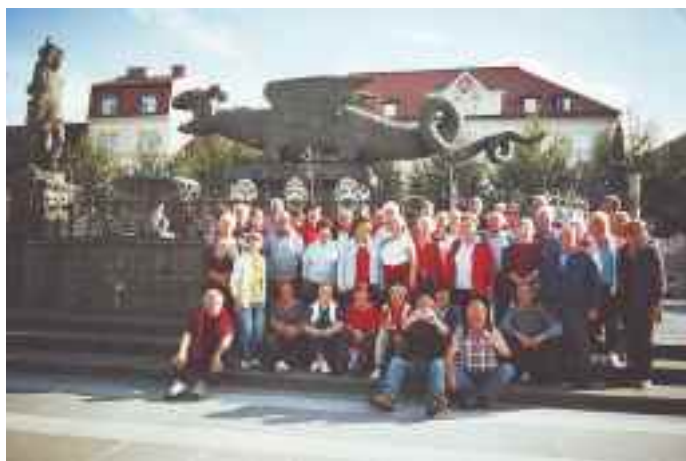
Zadovoljni in nasmejani udeleženci izleta na Dobrač

V letošnjem letu smo se preselili v novo večnamensko stavbo na Vrbanški cesti 97 v Kamnici. Uradne ure so vsako sredo od 8. do 11. ure. Vsak prvi petek v mesecu je sestanek UO in NO društva, da pripravita program, pregledata realizacijo sprejetih sklepov, pregledujeta prejeta pošto in nanjo odgovarjata.