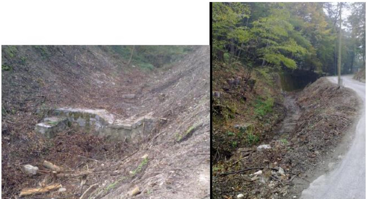
Slika 3: Obstoječe stanje

Obstoječa cesta na obravnavanem odseku poteka večinoma neposredno ob potoku, ki je v glavnini suh, oziroma je dotok zaledne vode majhen. Odvodnja obstoječe ceste se izvaja z asfaltnimi koritnicami in je speljana v jaške-peskolove, nato pa v strugo potoka.