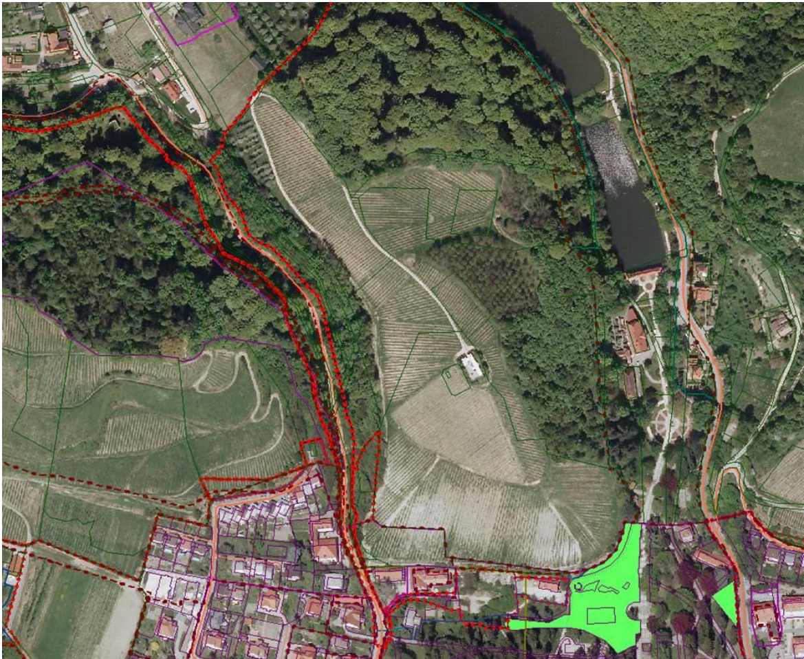
Slika 5: Lokacija ureditve