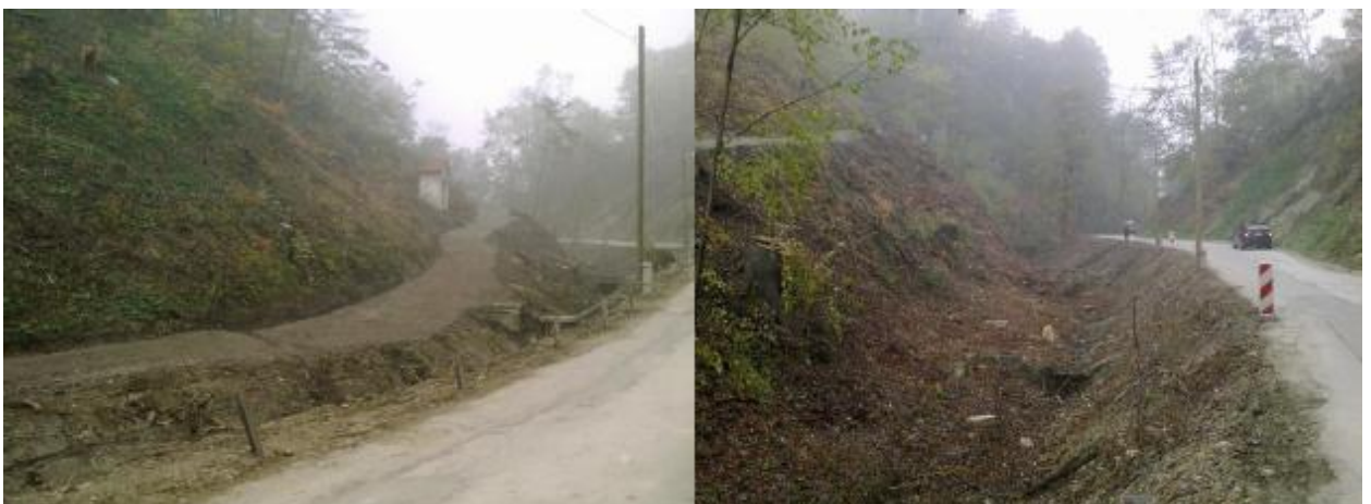
Slika 2: Obstoječe stanje

Lokalno je pobočje zelo nestabilno vsled globinskih vod, katere je potrebno drenirati.