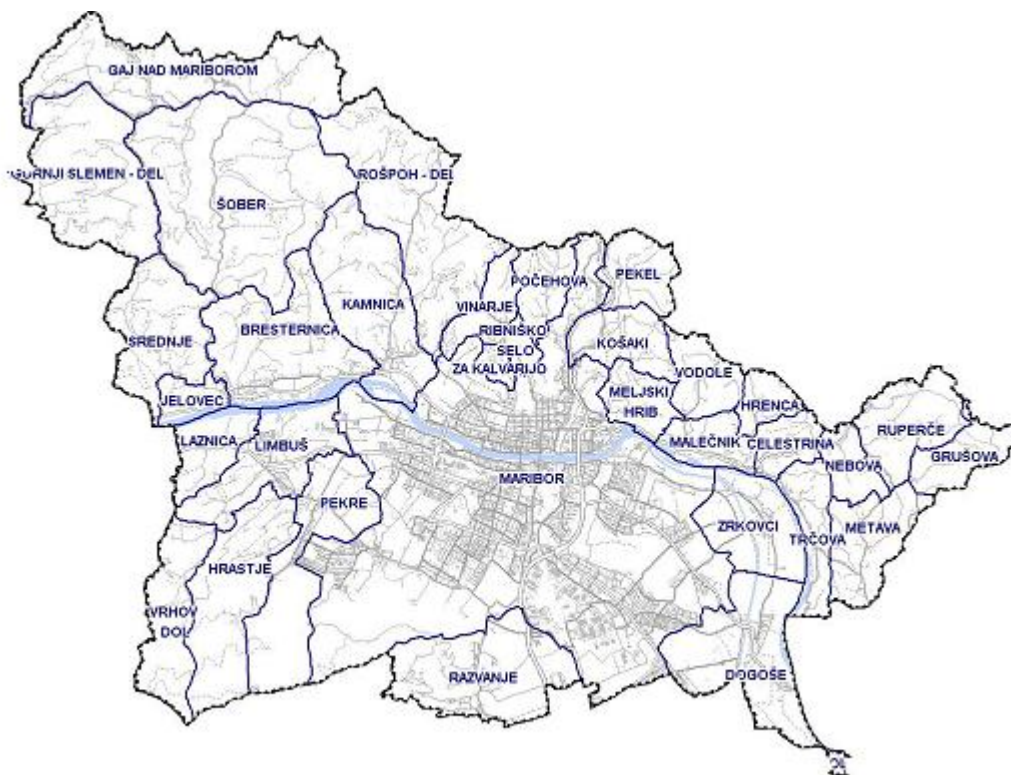
Slika 1: Mesto Maribor

Metava, Nebova, Pekel, Pekre, Počehova, Razvanje, Ribniško selo, Rošpoh - del, Ruperče, Srednje, Šober, Trčova, Vinarje, Vodole, Vrhov Dol, Za Kalvarijo, Zgornji Slemen - del, Zrkovci.