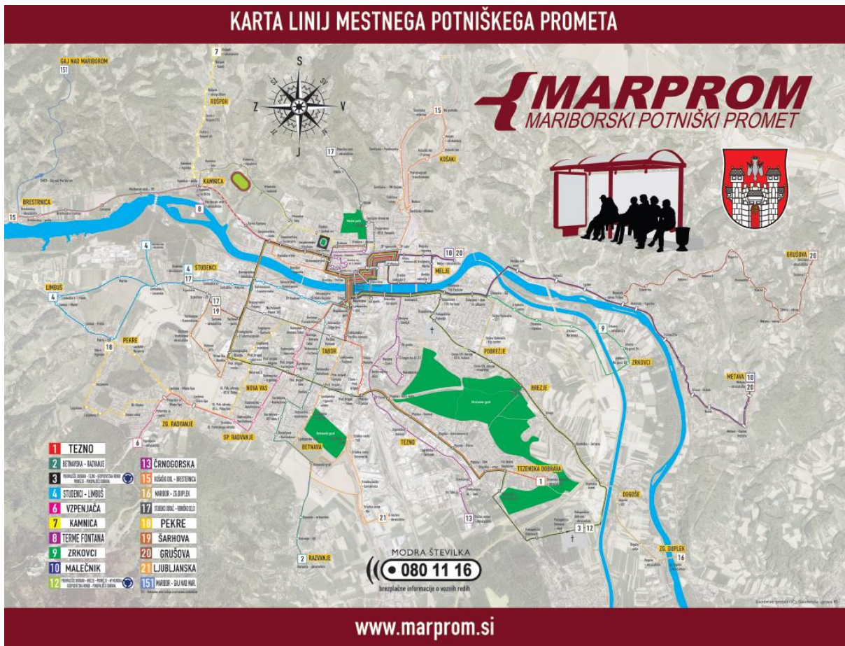
Slika 1: Karta linij mestnega potniškega prometa 9