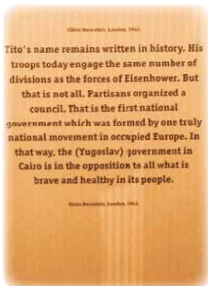
Muzej 2. zasedanja AVNOJ-a