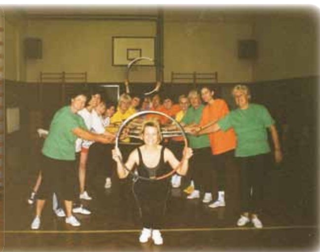
Mlajše članice, vaja z obroči