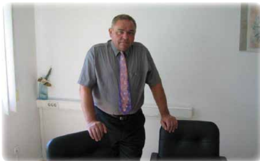
Predsednik sveta MČ Pobrežje

Vljudno vas vabim k branju našega glasila in vključevanju v programe, ki jih bomo skupaj z vami pričeli izvajati v jesenskem času.