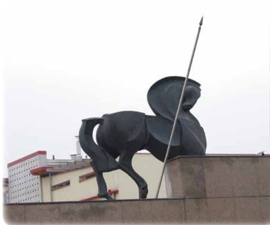
Spomenik knezu Koclju

jav. Tečaj bo brezplačen samo za krajane Pobrežja. Število prijav je omejeno.