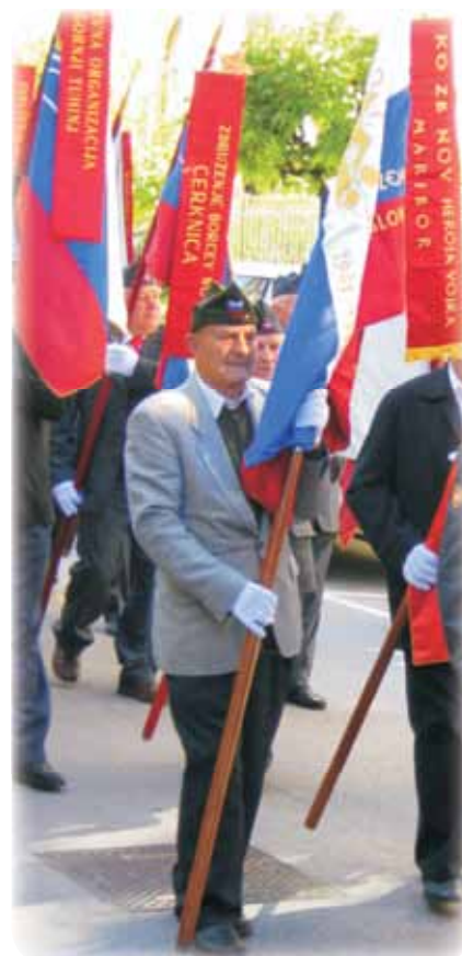
Praporščak Avgust, Ljubljana, april 2012

Vse navedene prireditve ohranjajo spomin na strahote okupatorja, kateremu so se odločno uprli prav ti