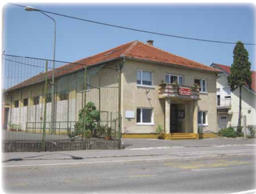
Dom DTV Partizan

Odlične rezultate in uspehe naših malih predšolskih telovadcev pa ob koncu vadbene sezone nagradimo s knjižico in bronastimi, sre-