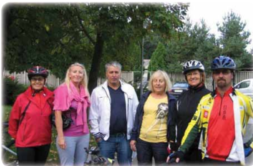
Pred startom kolesarjenja

V sodelovanju z uredniškim odborom smo obravnavali vaše predloge in nasvete. Prav tako vam v tej številki predstavljamo anketo o branosti glasila Pobreške novice ter pričakujemo vaša mnenja in predloge za objavo.