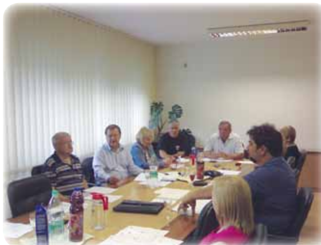
11. seja Sveta MČ Pobrežje