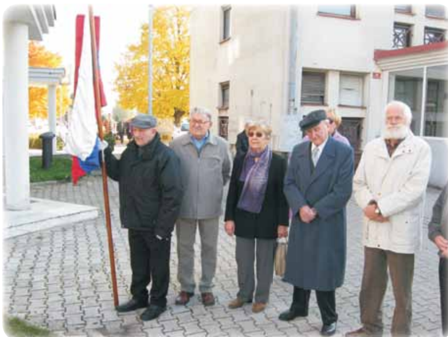
Ob plošči padlim pri Zdravstvenem domu dr. Adolfa Drolca na Pobrežju, 31. 10. 2011

sti, ki so ugotovili, da teh strahot ne bo konec, dokler ne bodo Slovenci ali izseljeni ali iztrebljeni. In to so bili borci narodnoosvobodilne borbe v partizanskih uniformah in s partizansko rdečo zvezdo na kapah. Ta zvezda je pomenila borbo za svobo-