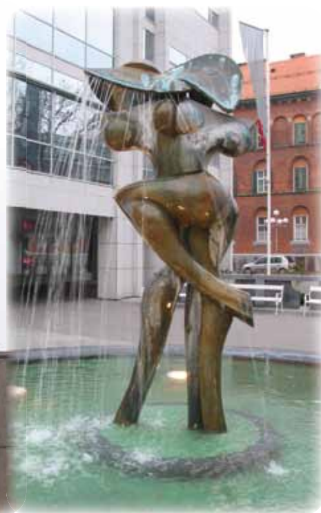
Fontana Ples vil