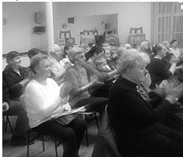
Proslava ob materinskem dnevu

Vedno bolj opažamo mrke obraze občanov in otožne oči, ki nas gledajo, v njih pa vidimo vsakodnevne probleme. Organizacija Rdečega Križa Magdalena se s svojimi prostovoljkami trudi, da jim vsaj malo blaži skrbi, zato jim pomagamo s paketi Rdečega Križa in pogovori, ki so zelo žalostni, vendar vsakemu občanu v veselje, saj se lahko le tako nekomu zaupa. Zato smo se z Mestno Četrtjo Magdalena in KUD Angel Besednjak dogovorili in 25.3.2015 pripravili čajanko za občane. Bili smo zelo veseli, da se je čajanki odzvalo veliko ljudi, da smo lahko poklepetali ob čaju, keksih in pecivu ter se zabavali ob programu KUD Angel Besednjak. Med občani je bila navzoča tudi gospa, ki šteje 90 pomladi, na kar smo še posebej ponosni.