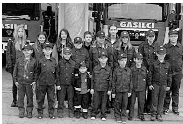
Ponosni smo na naš podmladek

S pomočjo finančnih sredstev, ki so bila v proračunu namenjena za vzdrževanje gasilskih domov, pa nam je uspelo v lanskem letu obnoviti dotrajano kurilnico in urediti umivalnico. Kljub velikim prizadevanjem naših članov, smo za to obnovo in ureditev vložili okoli 9.000 EUR. Z zbranimi finančnimi sredstvi in sredstvi požarnega sklada MO Maribor smo v lanskem letu nabavili nekaj prepotrebne opreme za varno in učinkovito delo naših operativnih gasilcev. Pri tem pa bi rad poudaril, da so nam bili v veliko pomoč naši sponzorji in donatorji, ki so nam pomagali s finančnimi prispevki. Zahvaljujem se vsem krajanom MČ Studenci in MČ Magdalena, ki so ob naši tradicionalni novoletni nabiralni akciji pokazali razumevanje za naše prostovoljno delo in za nabavo prepotrebne opreme za pomoč ljudem v nesreči. Predvsem pa velika hvala vsem, ki so ob naši nabiralni akciji za nabavo novega sodobnega gasilskega vozila pokazali razumevanje za naše potrebe.