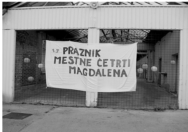
Se vidimo v letu 2015 !