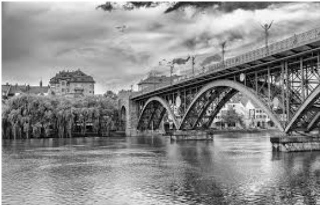
Stari most - Maribor

Šele z reko lahko mesto diha in utripa, kakor je to razlagal nono, ki že dolgo počiva na pokopališču v Nabrežini. Zato so prava mesta zmerom ob rekah. Po vsem svetu.