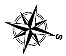
HEMA PRIKAZA CESTI: