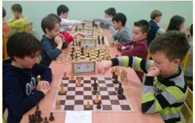
Šahovski turnir v Sladkem Vrhu

bilo razporejenih v 5 ekip. Turnir je predstavljal izjemno lepo šahovsko izkušnjo. Spodbujali so drug drugega in dobro razvijali ekipni duh.