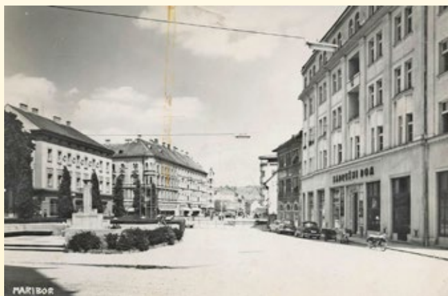
Maribor v 60-ih letih: levo Partizanska 7 s prvo samopostrežno, v kateri je bila pred tem Mestna knjižnica, desno zadružni dom, kjer je bila v pritličju Pionirska knjižnica

Za njen začetek štejemo ustanovitev Mestne knjižnice KUD Jože Hermanko, 8. februarja leta 1949, s prostori na Partizanski cesti 7. V šestdesetih letih se je morala od tam umakniti prvi samopostrežni v Mariboru.