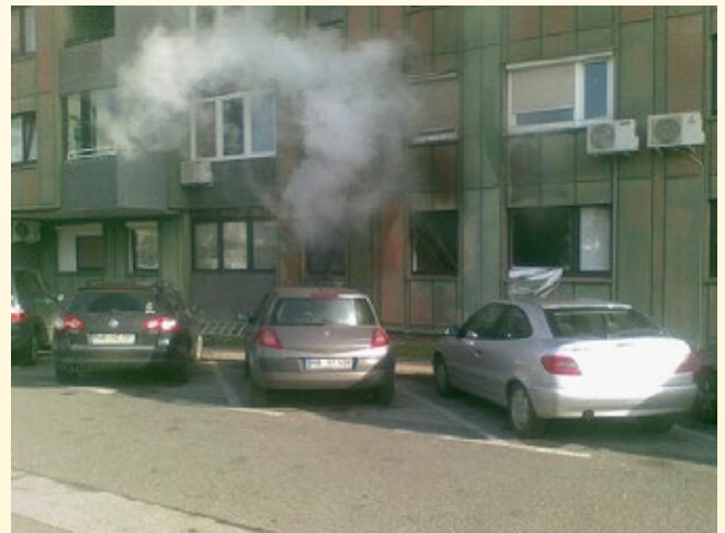
Požar na Radvanjski