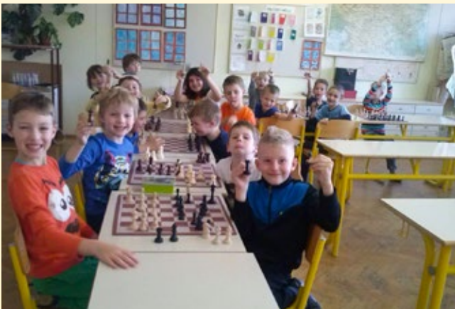
Šahovski krožek prve triade

V letošnjem šolskem letu na naši šoli šahira kar 70 učencev, največ iz prve triade. Šahovska igra jim je prirasla k srcu in vesela sem, da na krožek vsak teden prihajajo veseli in nasmejani, željni novih šahovskih izzivov.