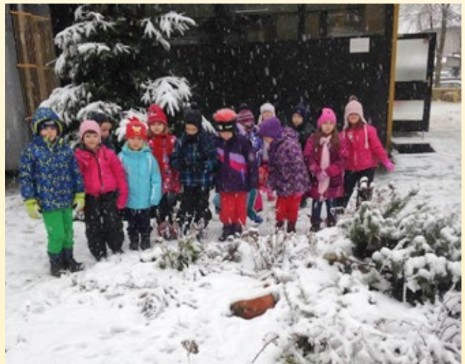
Zeliščni vrt v OE Oblakova pod snegom

Zeliščni vrt se spreminja iz meseca v mesec. In ko se začnejo prvi spomladanski dnevi, se prične tudi delo na našem vrtu. Otroci se tega že zelo veselijo, saj vedo, da bomo kmalu posejali nekaj novih semen, iz katerih bodo zrasle nove rastline.