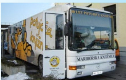
Prvi iz leta 1974, drugi je bil na poti od 1987 do 1999, sedanji potuje že 16. leto.

Dejavnost Mariborske knjižnice dosega prebivalce v Mariboru in v občinah Duplek, Hoče – Slivnica, Kungota, Lovrenc na Pohorju, Miklavž na Dravskem polju, Pesnica, Rače – Fram, Ruše, Selnica ob Dravi, Starše in Šentilj. Veliko našega dela lahko spoznate prek spletne strani knjižnice, marsikaj pa ostaja javnosti bolj skrito: na primer, kako pride gradivo med bralce, od nakupa in strokovne obdelave do ovijanja in ustrezne opreme. Tukaj so knjigovezi, ki znajo vrniti življenje še tako utrujenim knjigam, računalničarji, vzdrževalci in drugi, brez katerih si sodobne knjižnice ni mogoče predstavljati.