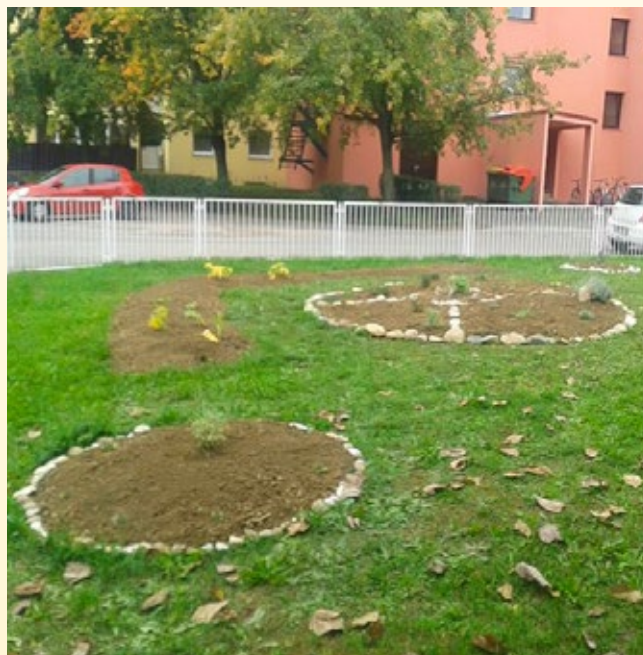
Tako se je začelo...

Ker veliko sodelujemo s starši, smo jih pozvali k sodelovanju pri zasaditvi zeliščnega vrta. Odziv staršev je bil velik in s skupnimi močmi je nastal lep zeliščni vrt, ki ga s pomočjo otrok skrbno urejamo. Zeliščni vrt dopolnjuje naše igrišče, otroci pa na zanimiv in igriv način pridobivajo nova spoznanja.