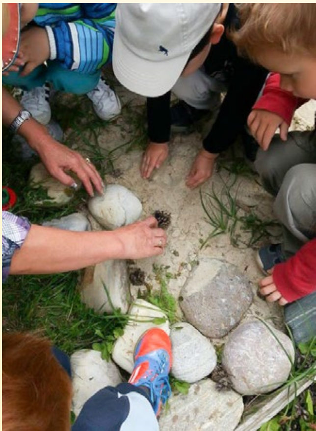
...pripravljamo čutno pot...

Vabljeni pa ste prav vsi kražani, da se prepričate, kako iz majhnega zraste veliko.