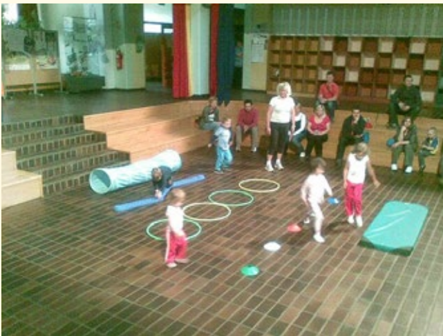
Kulturni program DTV Partizan Železničar ob tednu starejših

Na pobudo mestne četrti smo se povezali s patronažno službo. Naš cilj v letu 2014 pa je, da to storimo še s Centrom za socialno delo, saj smatramo, da edino dobro povezani, lahko kvalitetno pomagamo našim krajanom, čeprav se zavedamo, da bo na tej poti veliko ovir. Prav tako bomo poskusili izvesti poleg čajanke še izlet, ki je v lanskem letu, zaradi pomanjkanja sredstev, odpadel.