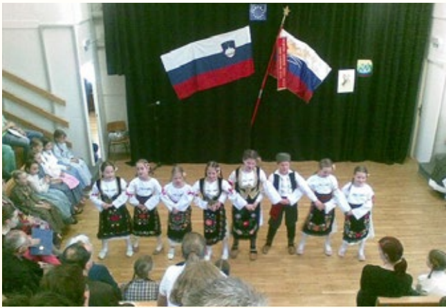
Prireditev ob Dnevu upora