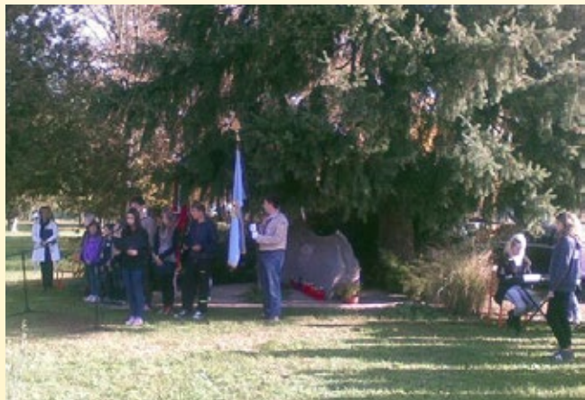
Komemoracija od Dnevu mrtvih pri Spomeniku talcev pri OŠ Leona Štuklja