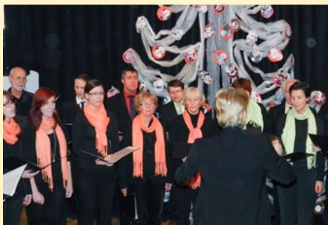
Božično novoletni koncert