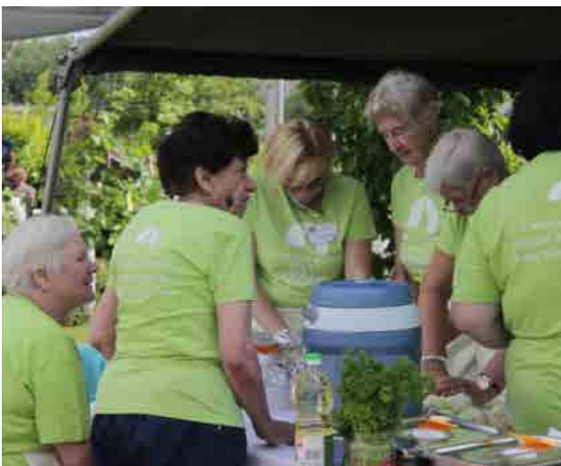
»Naše mojstrice so se profesionalno lotile kuhanja«