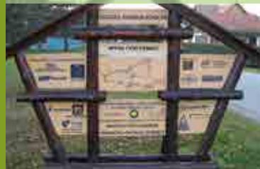
LESARSKA GOZDNA UČNA POT