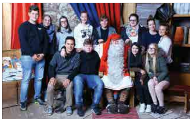
Zapisala: Danijela Kačinari, koordinatorka projekta.

V šolski knjižnici je na ogled zanimiva razstava z naslovom Kako preživeti na Finskem. Avtorji razstave so vsi dijaki in učitelji, ki so se udeležili jesenskih mobilnosti. Za pokušino si pogledjte sliko njihovega obiska pri Božičku