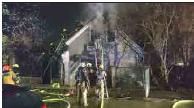
Požar na Ruški cesti 4

Člani so bili zelo prizadevni tudi pri vzdrževanju gasilskega doma in opreme, saj je pri teh delih sodelovalo 348 članov, za kar so porabili 668 delovnih ur. Vendar pa je bilo opravljenega še veliko ur dela ob udeležbi na raznih vajah (687 ur), izobraževanjih (113 ur), pripravah na tekmovanja na tekmovanjih in pri udeležbi na proslavah in