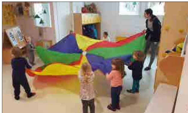
Vadbena ura s padalom

ci spoznavajo širše družbeno okolje, značilnosti kraja, se vključujejo v promet, se medsebojno družijo, spodbujajo, premagujejo naravne in umetne ovire, izvajajo naravne oblike gibanja na različnih površinah – trava, kamene, listje..