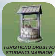
TURISTIČNO DRUŠTVO STUDENCI-MARIBOR