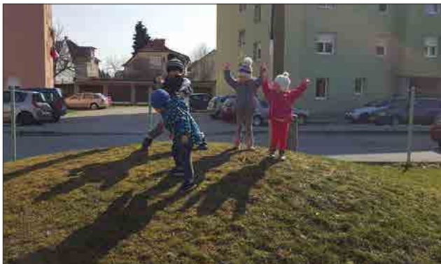
Naravne oblike gibanja