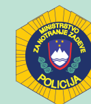
Policijska uprava Maribor