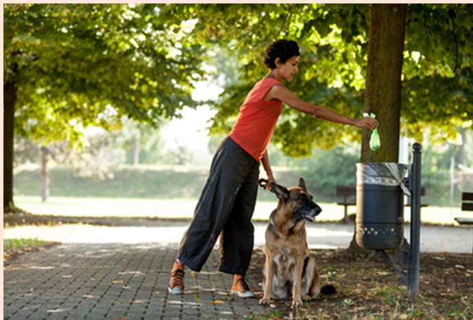
Odgovoren lastnik ali skrbnik pobira pasje iztrebke

Skrbnik je dolžan poskrbeti, da pes ni nevaren za okolico (vzgoja, šolanje, drugi ukrepi za zavarovan-