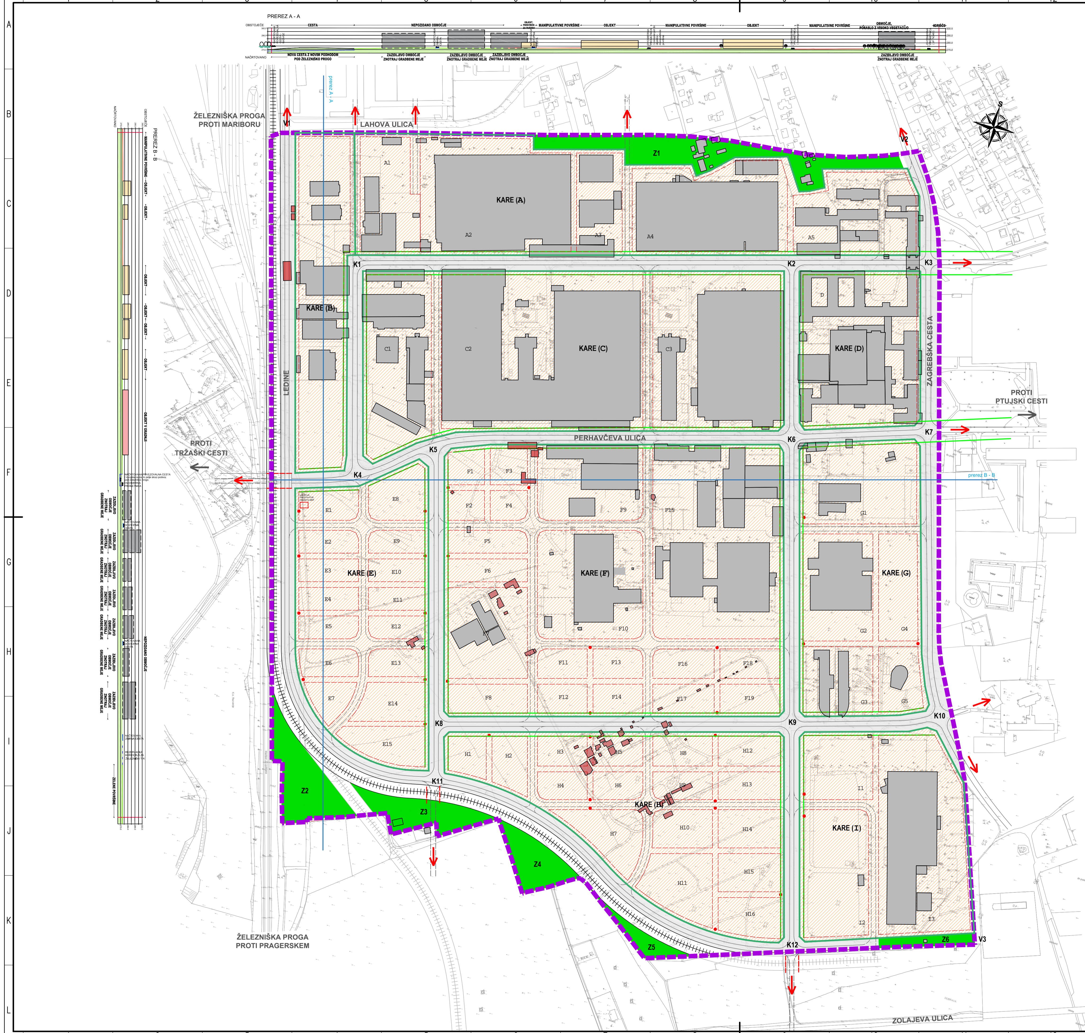
HEMA PRIKAZA CEST