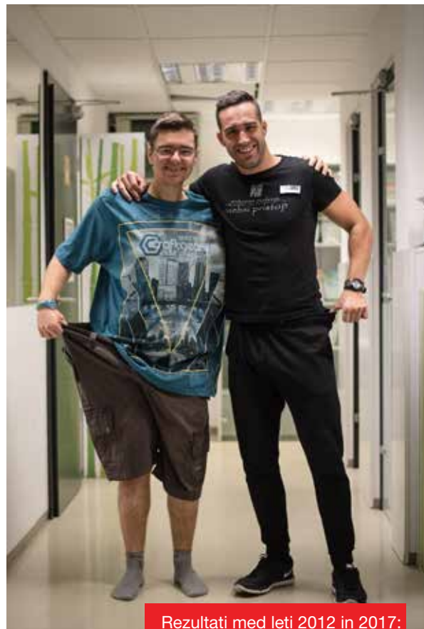
Rezultati med leti 2012 in 2017:

Raziskave so nedvoumno dokazale, da so nezadostna telesna dejavnost, stresen vsakdanjik in neprimerno prehranjevanje glavni vzroki slabega počutja in vir številnih bolezni. Tudi projekt »Kako fit je mesto« je pravzaprav raziskava, s katero se želi vsem občanom občine Maribor in drugih mest dokazati, da lahko tako dejavni kot nedejavni posamezniki vseh generacij in obeh spolov v sorazmerno kratkem času (v obdobju petih tednov) naredijo občutno spremembo v svojem počutju in zdravju.