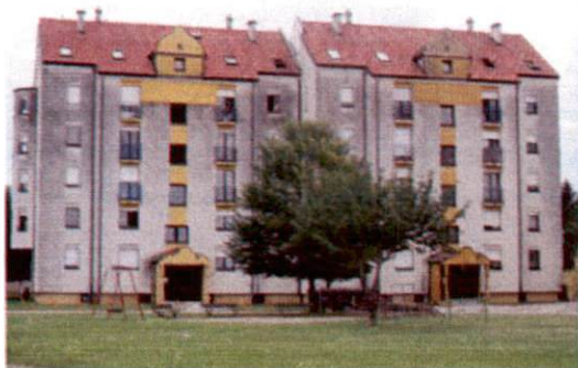
Projekt 1: Stavba Engelsova ulica 42 - 44