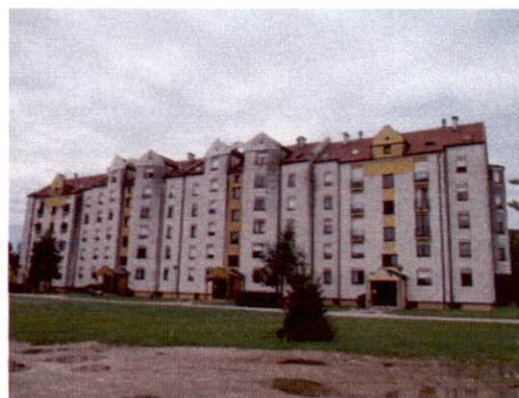
Projekt 2: Stavba Engelsova ulica 46 - 52