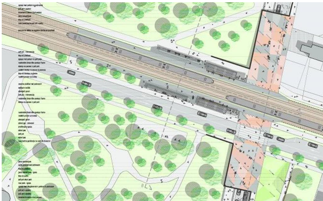
Slika 1: Situacija