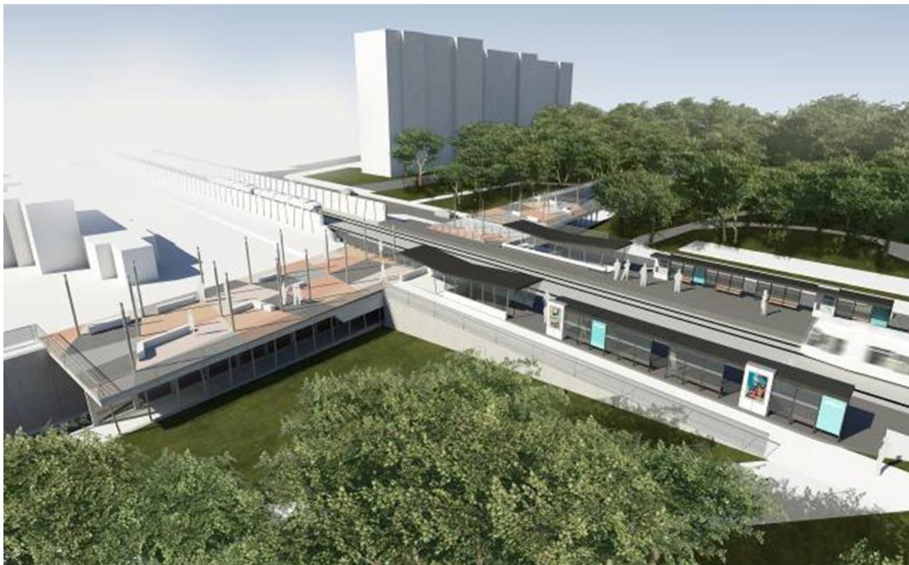
Slika 3: Vizualizacija – železniško postajališče – severna stran