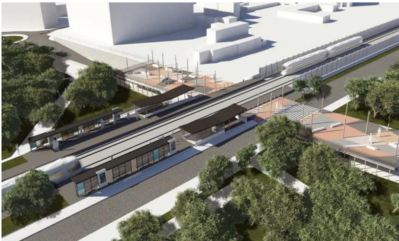
Slika 4: Vizualizacija - železniško postajališče – južna stran