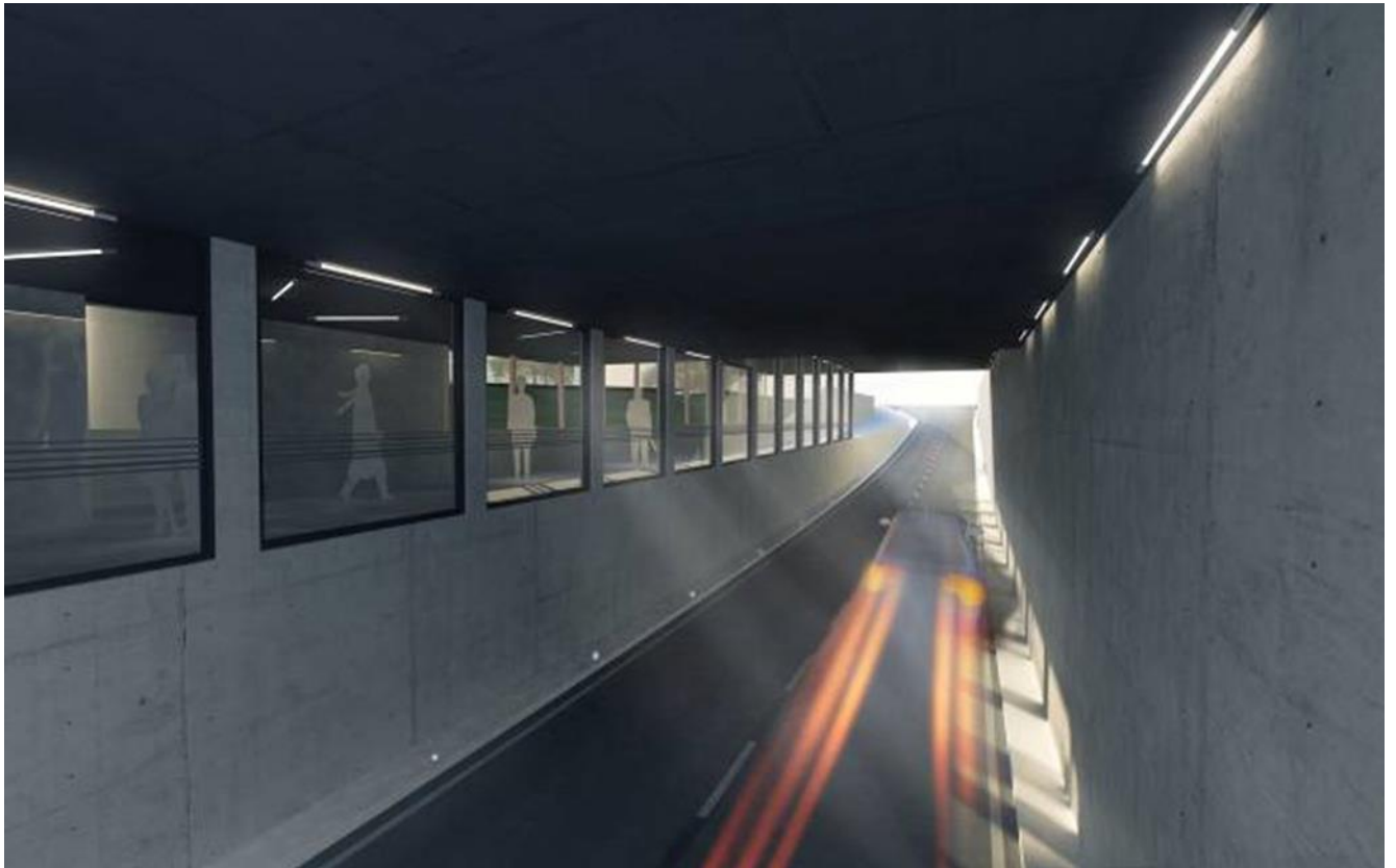
Slika 5: Vizualizacija - podvoz