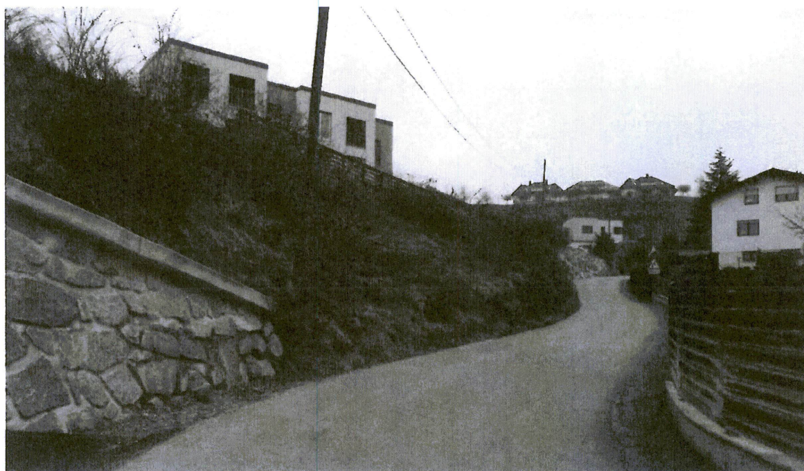
Slika 1: Pogled proti vzhodu