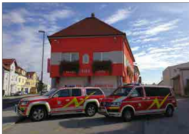
Novi gasilski vozili PV-1 (poveljniško vozilo) in GVM-1 (vozilo za prevoz moštva)

Lansko leto je bilo za studenške gasilce ponovno eno tistih, ki se bo vpisalo v zgodovino, saj nam je uspelo s pomočjo prostovoljnih finančnih prispevkov občanov in podjetij, lastnih sredstev ter sredstev, pridobljenih iz virov Javne gasilske službe Maribor, nabaviti kar dve novi