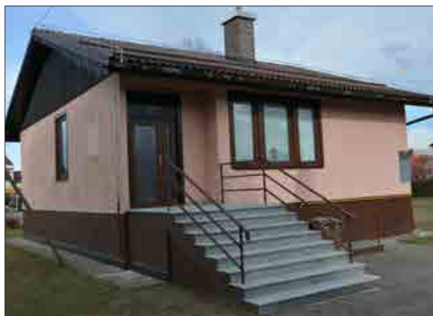
Stavba na Erjavčevi ulici