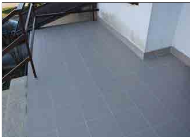
Sanacija stopniščnega podesta na Šarhovi