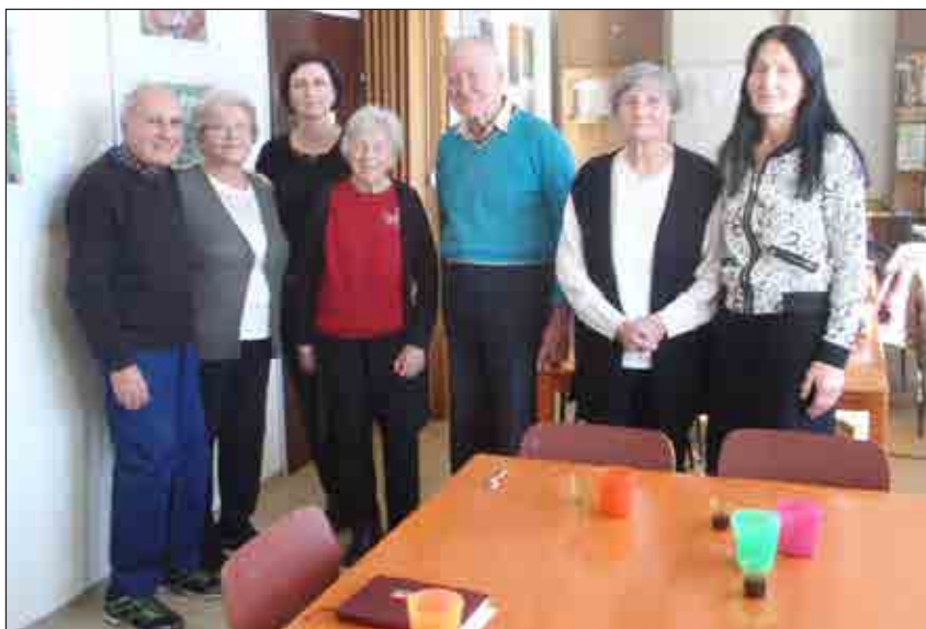
Člani skupine Vita z voditeljicama

Uro in pol druženja vsak torek med 10. in 11.30 je priložnost za pogovor o različnih temah, ki jih pripravi voditeljici. Druženje nas povezuje, zmanjšuje osamljenost in širi medsebojno pomoč in socialno mrežo. Skozi pogovor in izmenjavo mnenj smo se oblikovali v pravo prijatelj-