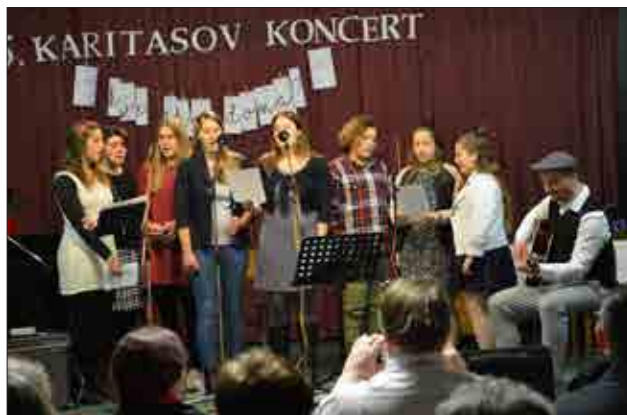
mladinski pevski zbor Studenček