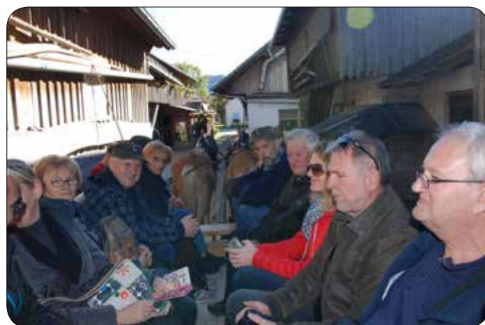
Pred vzletom »lojtrnika« ob Cerknškem jezeru.

Lanskega oktobra smo izvedli izlet na Notranjsko. V Ljubljani in si ogledali zbirko Muzeja VSO, nadaljevali z ogledom Tehničnega muzeja Slovenije v Bistri, obiskali pomnik tragično umrli ma teritorialcema na Cesarskem vrhu nad Vrhniko, spominsko obeležje TO v Logatcu, Muzej Cerknškega jezera in zaključili s »panoramsko« vožnjo z lojtrnikom.