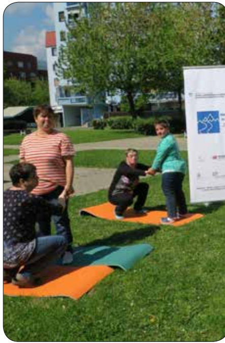
Vaje za težje gibljive uporabnike v VDC Sožitje Maribor, projekt Aktivni, zdravi, zadovoljni

Omogočamo kulturno, socialno in rekreativno udejstvovanje. Trudimo se za humanizacijo odnosov, čim višjo kvaliteto življenja stanovalcev ter upoštevanje njihovih želja in potreb v najvišji možni meri.