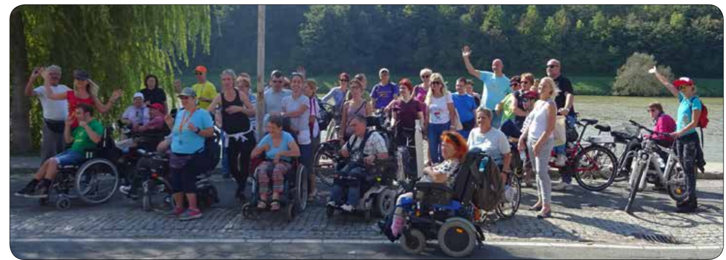
Ni bilo prav poceni, pa še čakati smo morali!

Stalnica spoznavanja mest, ki jih na izletih obiskujemo, so vodeni ogledi po starih mestnih jedrih. Kamnik je mesto z