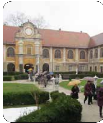
Izlet - Grad Štatenberg

Že vrsto let v program dela zapišemo tudi druženje. Tako smo si v marcu ogledali dvorec Štatenberg pri Makolah, aprila organizirali rekreativni piknik s pohodom, namiznim tenisom, ruskim kegljanjem in pikadom na Domu Jelka Pohorje, maja smo se udeležili športno rekreativnega srečanja diabetikov Slovenije v Dolenjskih toplicah, si ogledali izvir Krke, junija smo bili na Rogli in odšli na pohod do Lovrenških jezer, septembra izlet Trije kralji na Pohorju, oktobra kostanjev piknik, novembra izlet z martinovanjem in v decembru prednovolentno druženje ob glasbi v živo.