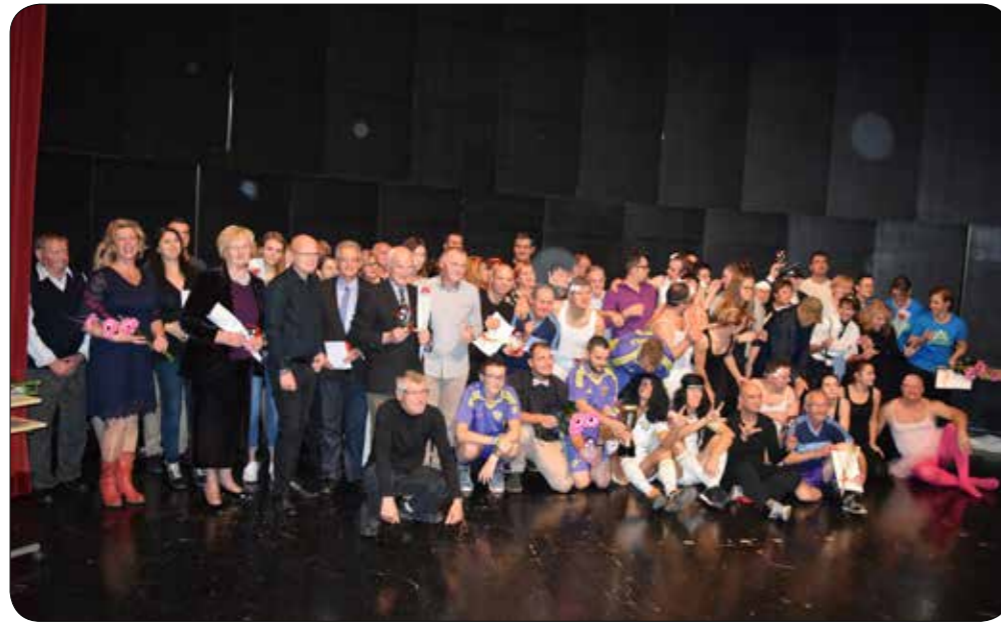
Gledališki festival gluhih