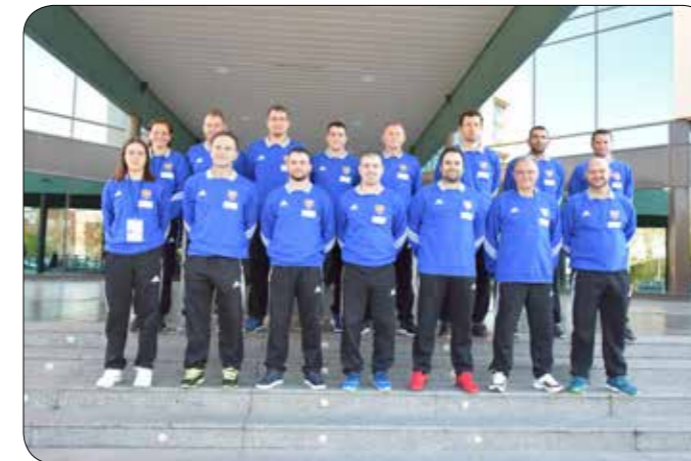
Futsal ekipa gluhih v Španiji

Društvo ima odlično ekipo v futsalu, ki dosega dobre rezultate na različnih tekmovanjih, in lahko se pohvalimo, da smo osvojili kar lepo število pokalov.