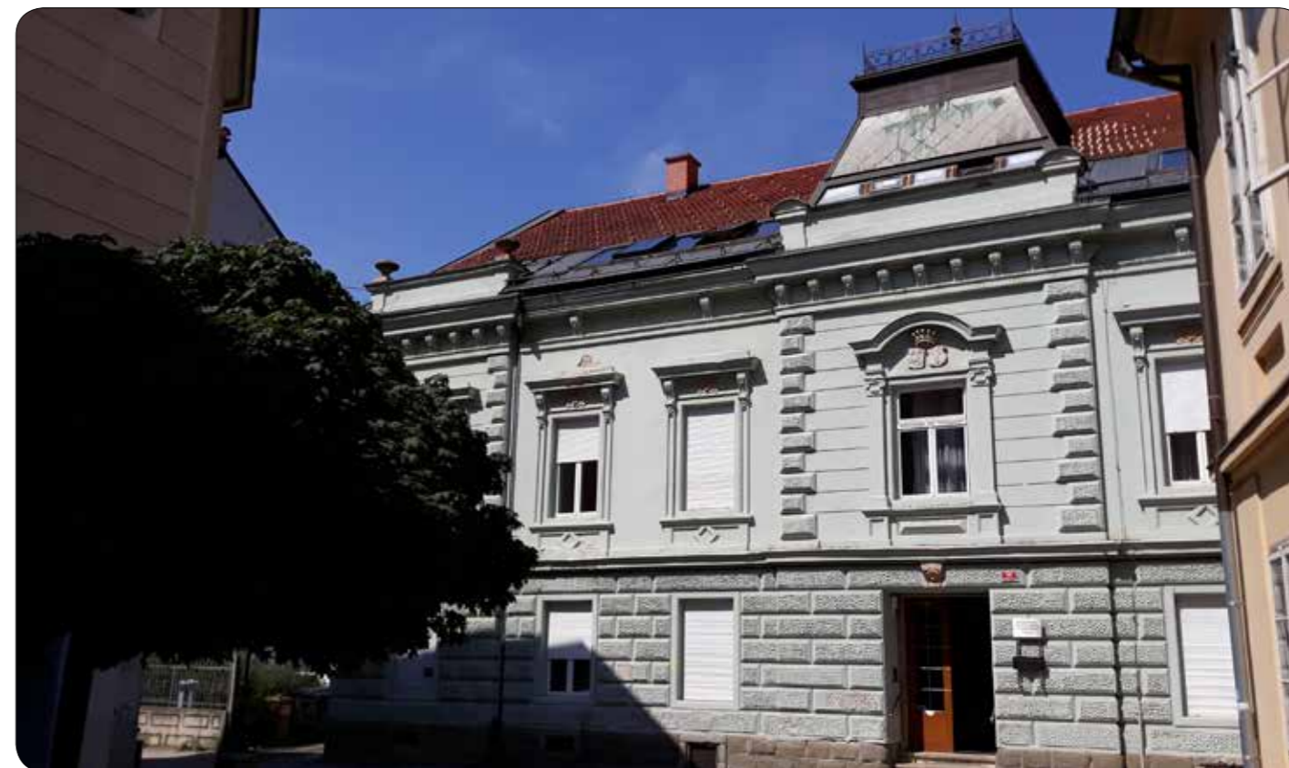
Medobčinsko društvo slepih in slabovidnih Maribor, Gospejna 11

Skrb za slepe osebe sega v čas Avstro-ogrske. Večina tistih slepih, ki se je pred prvo svetovno vojno in med njo šolala v avstrijskih zavodih za slepe je bila včlanjena v Podporno društvo slepih Avstrije, ki je svojim članom pomagala pri zaposlitvi, socialno šibkim pa z denarnimi prispevki. A v to društvo je bil včlanjen le manjši del slepih iz Slovenije. Z razpadom Avstro-ogrske so ostali brez vsakršne organizacije. Ustanovitev slovenske organizacije slepih sega v oktober leta 1920, ko so ustanovili Podporno društvo slepih Slovenije. Glavna naloga društva je bila zbiranje denarja za pomoč socialno ogroženim. Denar so jim namenjali privatniki, občine in banska uprava. V letu 1939 se je društvo preimenovalo v Društvo slepih in je delovalo tudi med drugo svetovno vojno do leta 1945, ko je bilo z dekretom razpuščeno. Naslednje leto so slepi ponovno dobili svojo organizacijo. V Ljubljani je bila leta 1946 ustanovna skupščina Združenja slepih Jugoslavije za Slovenijo. Namen je bil, da zberejo in včlanijo slepe v združenja in jim tako pomagajo na gospodarskem, socialnem, kulturnem in prosvetnem področju. Naši predhodniki so si pridobili ustrezno izobrazbo, strokovno usposobljenost, nastala je Braillova tiskarna, Knjižnica za slepe v brajlovi pisavi deluje neprekinjeno od leta 1920 do danes.