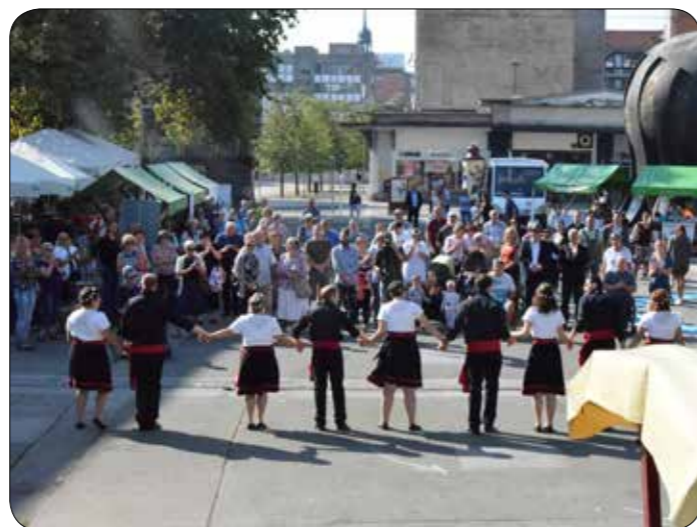
Dan mobilnosti invalidov na Trgu svobode v Mariboru

Invalidska društva in druge organizacije za pomoč invalidom so se predstavili na stojnicah in pripravili krajši kulturni program.