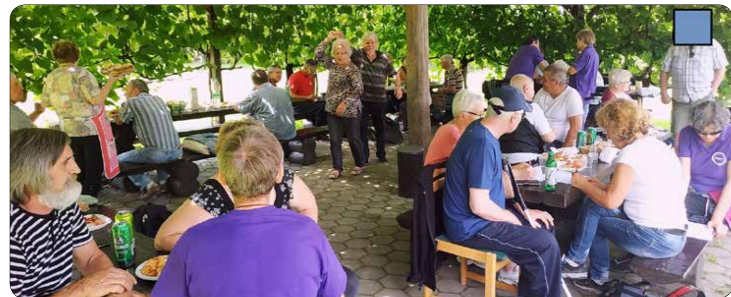
Piknik pri LD Radvanje

In ne samo to, večina članov je že prišla. Naš odgovorni član za družabni program jih je že opremil z rekviziti za prvo igro. Tudi meni je zavezal napihnen balon okoli pasu, pa še niti