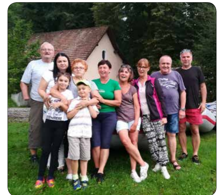
Tri generacije članov Združenja 91 pred podvigom.

Predstavniki združenja smo septembra v okviru programa Sveta invalidov Mestne občine Maribor, ob evropskem tednu mobilnosti, pripravili »Kolesarski pohod« za vse skupine invalidov z našega konca. Pohod je sledil motu letošnjega tedna mobilnosti »Združuj in učinkovito potuj!«, naš pohod pa smo naslovili »Sprehod ob Dravi, s pogledi na mostove, takšne in drugačne.« Na sprehodu, ki se ga je udeležilo čez 60 pohodnikov, smo predstavili zgodovino mariborskih mostov čez reko Dravo. Ker nismo premagali celotne poti, ki je dolga 4,2 km in spoznali vseh mostov, smo sklenili, da pot nadaljujemo ob drugi priložnosti.