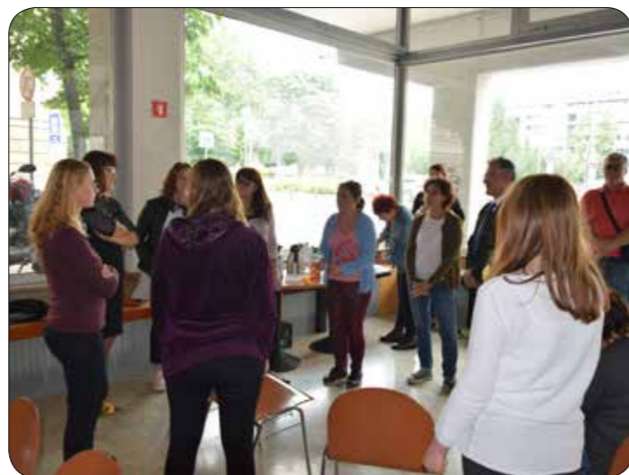
Posvet o dostopnosti knjižnic invalidom

Hkrati smo ugotavljali, da kljub napredku obstajajo še določene sistemske ovire, kot je arhitekturna in komunikacijska nedostopnost, pomanjkljivi predpisi in knjižnični informacijski sistem, kjer bodo še potrebne spremembe. V Svetu invalidov bomo na to skupaj s knjižnicami tudi opozarjali.