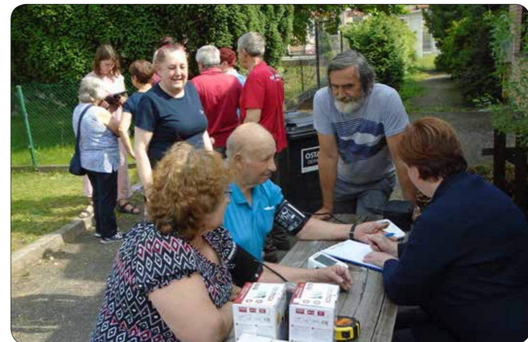
Meritve krvnega tlaka v Šubičevi ulici

Naši člani so aktivni tudi v raznih športnih panogah. Trenirajo in tekmujejo v ruskem kegljanju in pikadu. Zadnja leta so zelo uspešni v ruskem kegljanju, kjer dosegajo vidne rezultate.