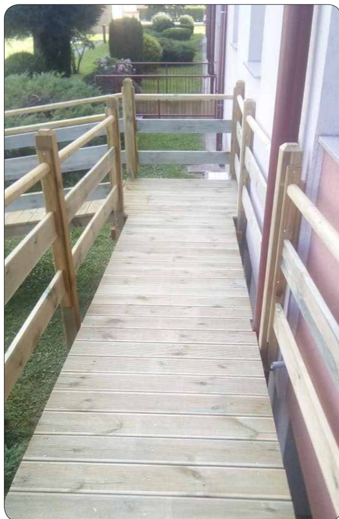
Klančina do balkona, drugi del

Multipla skleroza je zelo nepredvidljiva bolezen, saj nikoli ne veš, kdaj ne boš mogel narediti nekaj samoumevnega. V trenutku lahko začutiš bolečino, mravljinčenje nog, rok, obraza ali iznenada začutiš vročino in ne moreš vstati iz postelje. Skratka, naša bolezen ima tisoč obrazov in vsak izmed nas jo drugače doživlja.