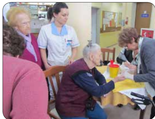
Meritve sladkorja v krvi Dom D.Vogrincec-Tabor

Preventivnim programom za preprečevanje sladkorne bolezni dajemo v Društvu diabetikov Maribor največjo pozornost in v sklopu teh aktivnosti so tudi meritve krvnega sladkorja. Brezplačno smo izmerili krvni sladkor več kot 1500 občanom. Društvo je izvajalo aktivnosti na različnih krajih. Radi pridejo tudi v delovne organizacije