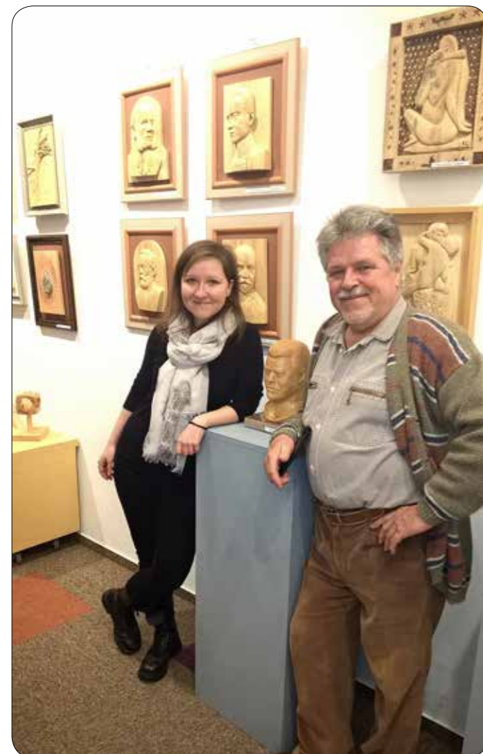
Razstava likovnih del - Ivan Komel