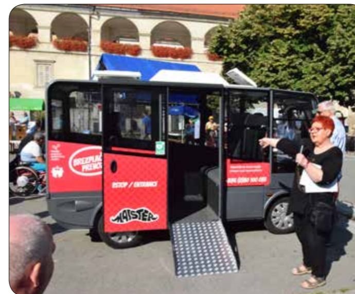
Brezplačni avtobus Maister s spuščeno klančino