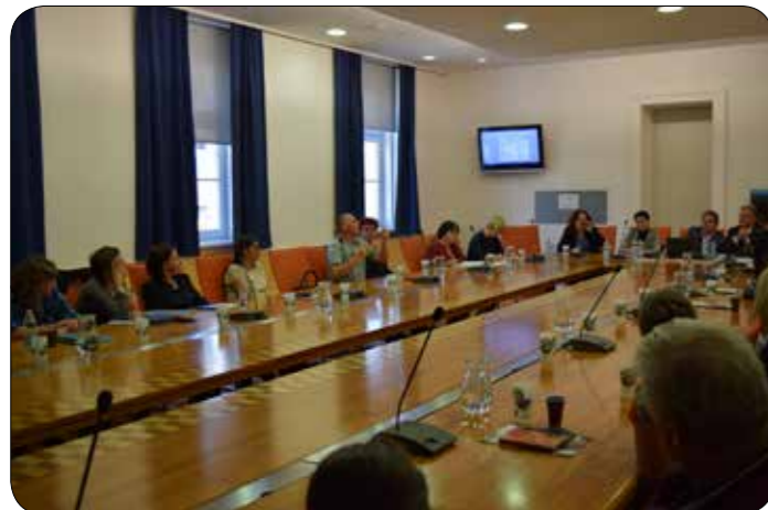
Posvet o socialnovarstvenih pravicah invalidov

Direktorica Centra za socialno delo Maribor je na kratko predstavila reorganizacijo Centrov za socialno delo, ki se udejanja z oktobrom 2018.