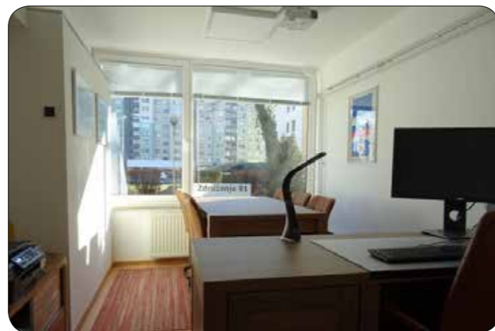
Pisarna Združenja 91 na Kardeljevi 60 v Mariboru.