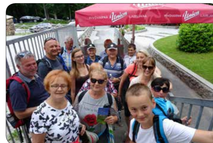
Ni bilo prav poceni, pa še čakati smo morali!

bogato vsebino, naš sprehod po njegovem središču pa smo končali v frančiškanskem samostanu Sv. Jakoba, kjer smo si ogledali zadnjo Plečnikovo stvaritev – Kapelo božjega groba, ki je urejena v zanj značilnem slogu in je bila dokončana leto pred njegovo smrtjo.