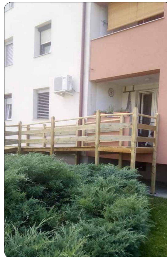
Pogled na klančino od daleč

Za ureditev montažne klančine je potreboval 75 % soglasje lastnikov večstanovanjske zgradbe, v kateri je stanoval s svojo družino. Po dveh mesecih je končno zbral potrebno število podpisov. Za grajeno klančino pa bi potreboval 100 % soglasje lastnikov večstanovanjske zgradbe in gradbeno dovoljenje. V stanovanjih, ki so v najemu, pa ni prišel do podpisa lastnikov. Prizadeto je dejal: »Najemnikom je vseeno za tebe, če si oseba s posebnimi potrebami, saj oni nimajo teh težav in te ne razumejo.«