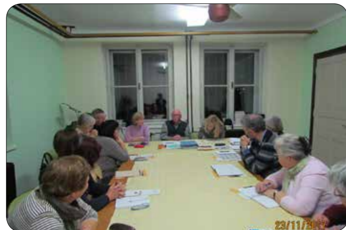
Šola zdravega življenja

Ena od oblik izobraževanja so učne delavnice s skupnim naslovom »Štirje koraki za izboljšanje sladkorne bolezni«. Delavnice v društvu pripravljamo že tretje leto in vsak prvi torek v mesecu se dobimo v predavalnici na sedežu društva. Pred pričetkom izvedemo meritve sladkorja v krvi, predstavimo merilnike sladkorja in kako jih pravilno uporabljamo. Sledijo