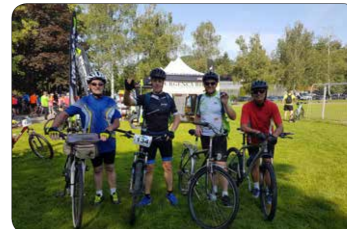
Kolesarski maraton AJM

Vsak torek imamo prijateljski turnir v ruskem kegljanju, kate-rega se naši člani redno udeležujejo. Prav tako naši strastni ribiči poskrbijo za težek ulov, saj so redno prisotni na raznih ribičkih turnirjih. Vsekakor se lahko pohvalimo, da imamo med našimi gluhihimi člani tudi zelo dobre kolesarje, ki so v letošnjem letu prevozili Poli maraton, maraton okoli Pohorja, maraton Rogaška, maraton po Prlekiji in maraton AJM. Športne igre invalidov SI MOM, naši člani se jih redno udeležijo, število tekmovalcev iz leta v leto raste. Ekipa bowlinga se srečuje na rednih treningih v Planetu Tuš, tako so svoje znanje pokazali