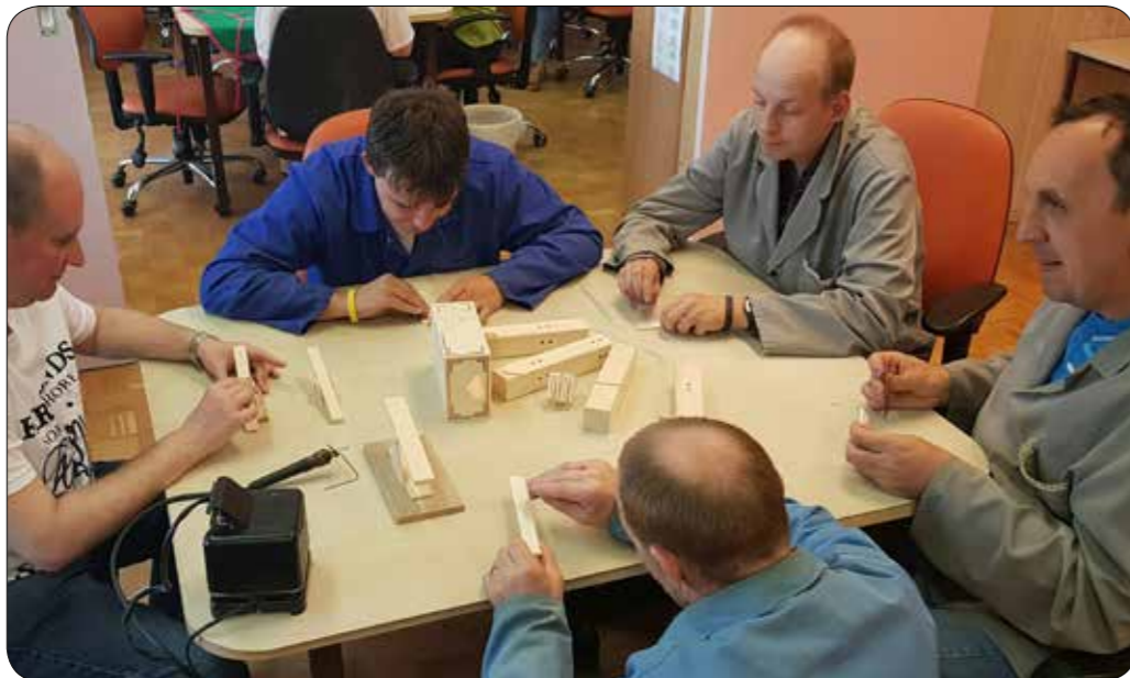
Zaposlitev v delavnici VDC Sožitje Maribor