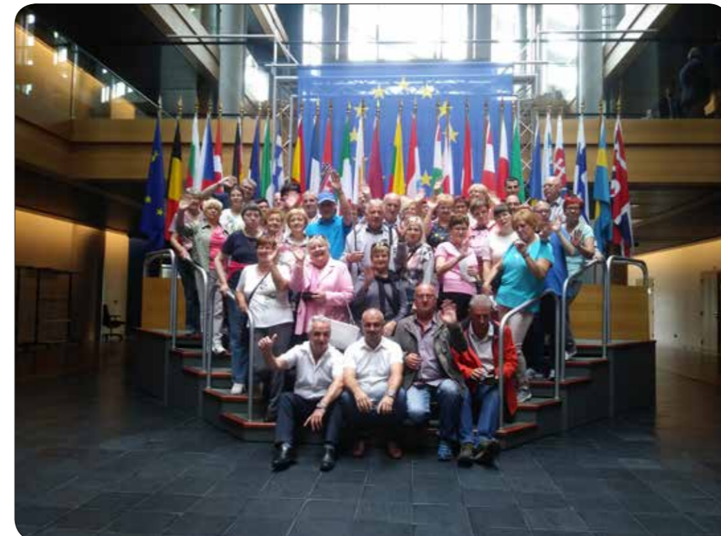
Društveni izlet v Strasbourg

Trudimo se povezovati z okoljem s ciljem zagotavljanja čim večje integracije uporabnikov. Zato sodelujemo na različnih