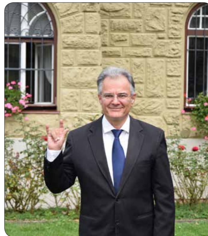
Avtor: Milan Kotnik, predsednik SIMOM