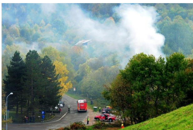
Vaja PGD Pekre.

Vsako leto izdamo lastno glasilo »PEKRSKI GASILEC«, s katerim letno seznanimo podporne člane z našim delom v preteklem letu. Prav je, da se ljudje seznanijo kam so vložili svoj prispevek za delo gasilskega društva.