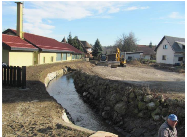
Urejanje Pekrskega potoka.