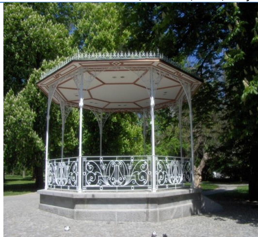
Kopija paviljona v mariborskem mestnem parku.

Tukaj, na Cesti graške gore, na robu naselja je delo steklo s podvojeno močjo in prav tukaj se že 32 let srečujem z uspehi in neuspehi, z dobrimi in manj dobrimi ljudmi, ki jih v delavnico pripeljejo jasni in kdaj pa kdaj tudi sumljivi nameni.