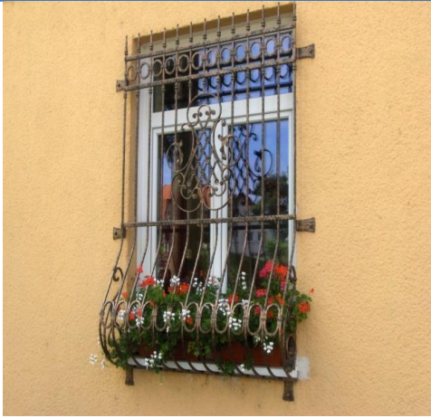
Okno gasilskega doma Pekre.