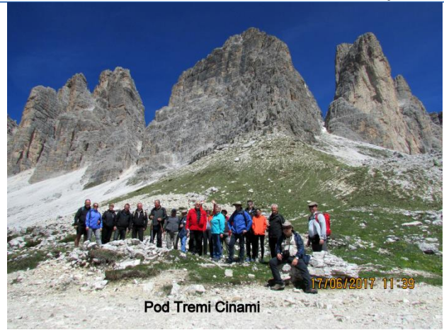
Pod Treh Cimami

V krasnem in sončnem vremenu, smo občudovali bližnje tritisočake in ostale vrhove, ki so bili obdani s soncem. Počasi smo krenili nazaj do kočice Auronzo, kjer so nas čakali ostali člani izleta in se po obilni malici spustili z avtobusom do znamenitega in zelo lepega jezera Misurina (1752 m), katerega smo si tudi ogledali.