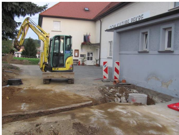
Gradnja hidroizolacije na Domu kulture Pekar.

kanalizacije v predelu starega dela Pekar. Opravičeno so krajanje ogorčeni, ker se zadeva z izgradnjo tako pomembne komunalne naprave ne premakne že od leta 2010. Svet KS zagotavlja, do bo problematiko kanalizacije ponovno izpostavil Mestni občini Maribor kot prioriteto pri pripravi proračuna za leto 2019.