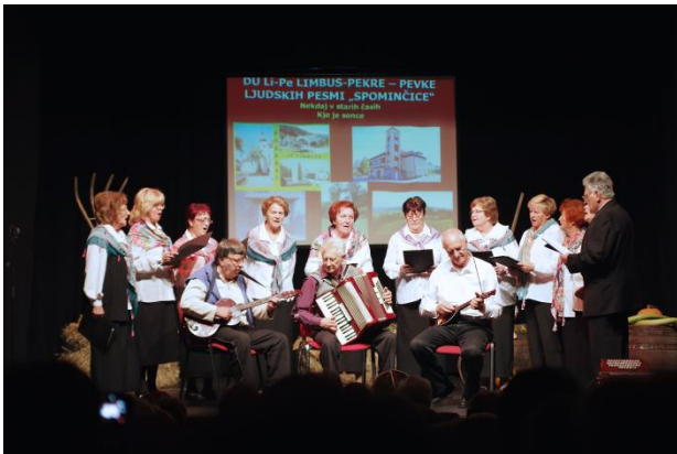
Pevke ljudskih pesmi – Spominčice.

In že smo pri prijateljih v Pekrah. Mislim, da ni Pekrčana, ki ne bi vedel za naše vrle kegljače s kroglo na vrvici. Za svoje delovanje imajo kar dva prostora, da lahko nemoteno »kegljajo« skozi vse leto. Zaradi pogojev igranja kraljevske igre si naši šahisti delijo svoje prostore tako v Limbušu in Pekrah. Že 25 let naše ročnodelke »ROŽICE« ustvarjajo svoje umetnine v KS Pekre. Jubilej so praznovale v letu 2017 in prejele Priznanje PZDU Maribor in Malo plaketo KS Pekre.