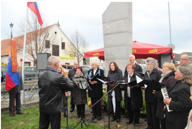
Mešani pevski zbor DU LI-PE na komemoraciji pred spomenikom padlih v Limbušu.

Vse te sekcije niso same sebi namen. Pevci MePZ in Spominčice nastopajo po domovih za ostarele, na vseh prireditvah v kraju (srečanje starejših, ZB, komemoracija ob spomeniku)... Likovniki in ročnodelke iz Limbuša in Pekar svoje izdelke prikažejo na razstavah v mesecu maju v čast praznikov KS Limbuša in Pekar. Prav tako odigrajo v čast praznovanj svoje turnirje tudi naši šahisti in kegljači.