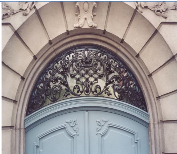
Kopija stare mreže na Mestni občini Ljubljana.

Sledila je edina daljša prekinitev poklicnega dela – leta 1977 vpoklic v Jugoslovansko ljudsko armado – natančneje v njeno mornarico, kjer sem preživel 18 mesecev. Vrnitev domov je pomenila, da gre poklicno zares – v smeri, ki sem si jo načrtoval. Na začetku leta 1979 sem dobil službo v kovačnici Tovarne kmetijske opreme Tehnostroj v Ljutomeru. Čeprav je najprej izgledalo obetavno pa sem kmalu spoznal zablode normiranega dela, kaj pomenijo slabi medčloveški odnosi na delovnem mestu ter povrh vsega še to, da poštenemu in trdemu delu mladega idealista v poklicu nikakor ne sledi tudi pričakovano plačilo obljubljenе višine. Po slabih devetih mesecih sem dal odpoved in se zaposlil v sosednjem obratu Mariborske tekstilne tovarne (MTT) Ljutomer od koder so me po mesecu dni dela poslali v matično tovarno v Maribor, kjer sem opravil 3 tedenski tečaj za mojstra – serviserja tkalskih strojev. Delovno okolje v tekstilnem obratu je bilo povsem drugačno, odnosi odlični, plača boljša, vendar so moje misli in ambicije hitele naprej.