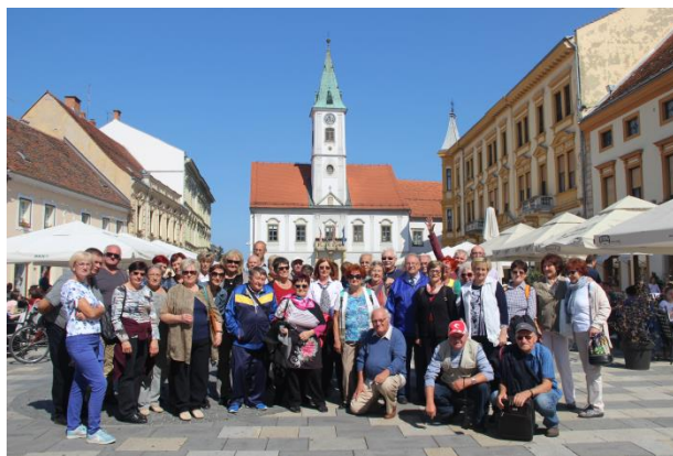
Izlet v Varaždin.