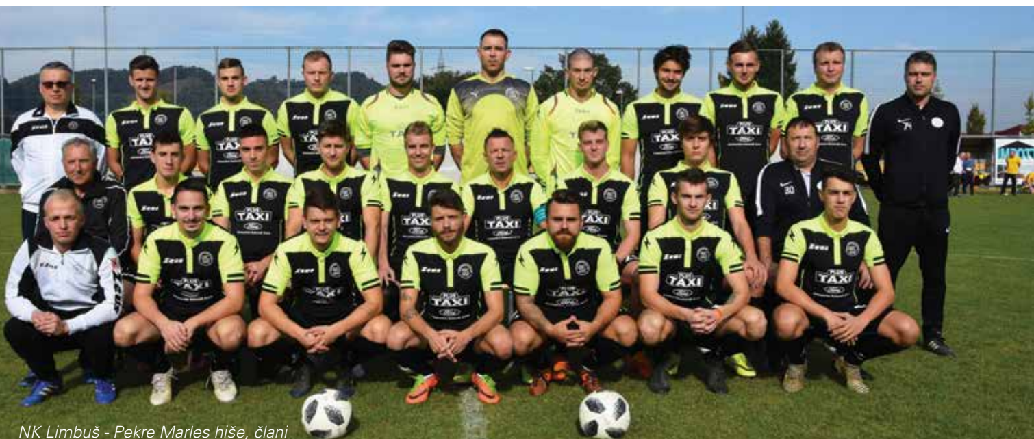
NK Limbuš - Pekre Marles hiše, člani