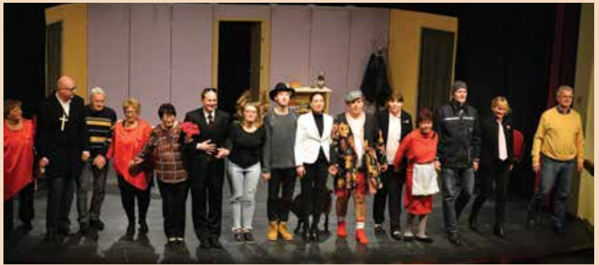
Odrasla gledališka skupina KD Pekre-Limbuš