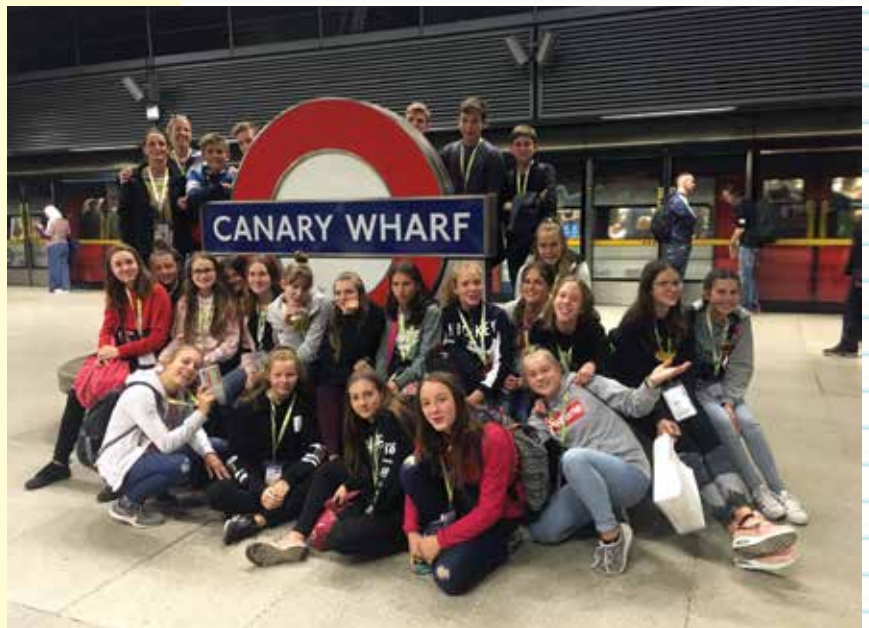
Na podzemni postaji v Londonu

toliko zanimivejši in polni prijetnih občutkov. Za mnoge je že sam polet z letalom bil velik podvig, saj so bili prvič na letališču in se peljali z letalom. V Londonu smo se vozili tako z znamenitim rdečim dvonadstropnim avtobusom kot tudi s podzemno železnico, vlakom in ladjo. Bili smo nastanjeni v hotelu, ki je bil zelo lep in nedaleč stran od samega središča Londona. Ogledali smo si vse bolj znane znamenitosti tega veličastnega in kraljevega mesta: znamenito tržnico Camdem Town, angleški parlament Houses of Parliament, stolp Elizabeth Tower z znamenitim zvonom Big Ben, Westminster Abbey, kjer že stoletja kronajo angleške kralje in kraljice. Skozi St. James park smo se sprehodili in prišli do Buckinghamske palače, prebivališča britanske kraljice Elizabete II. Tam smo si najprej ogledali menjavo straže, nato pa se, vodeno, sprehodili po palači. Prav tako smo si ogledali muzej voščenih lutk Madame Tussauds, narodno galerijo, muzeje ter znamenito ulico Downing Street, kjer na številki 10 biva angleška »Prime Minister«, Theresa May. Sprehodili smo se tudi do Greenwicha, kjer se sti-