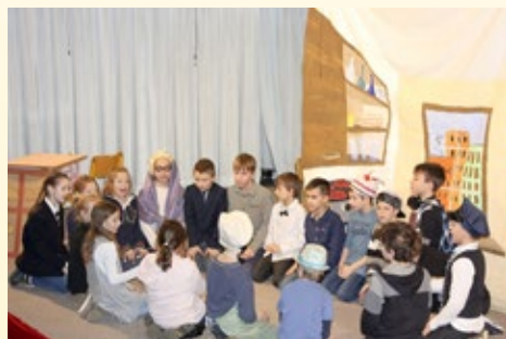
OŠ Ledina; Happy birthday