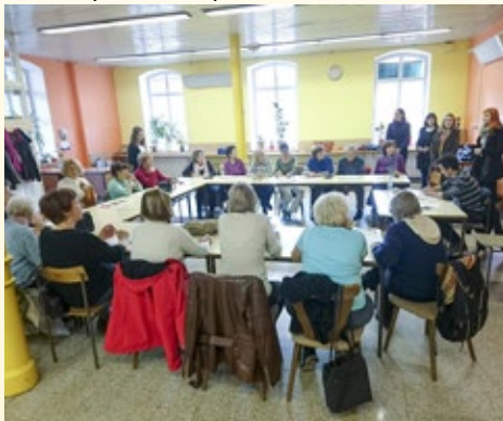
TRENING MOŽGANOV, 23.11.2016

Posebej bi omenili še Mojstrsko delavnico in Hobby delavnico, v katerih izdelujejo različne izdelke iz lesa in drugih materialov, veliko pa pomagajo tudi pri vzdrževanju in obnovi poslovnih prostorov.