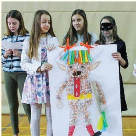
Predstavitve tradicionalnih pustnih likov v šolski telovadnici

tradicionalne pustne maske Slovenije. Izvedeli smo kdo so piceki, mačkare, škoromati in mnogi drugi zanimivi liki, ki preganjajo temo in kličejo k novi rasti in brstenju pomladi.