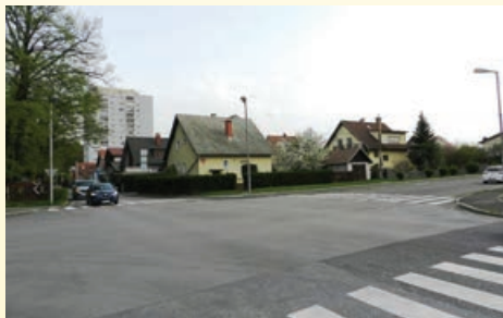
Sanirano križišče Betnavska cesta – Knafelčeva ulica

Čez celoten mandat smo si prizadevali, da se sanira Pengova ulica, uredi promet s parkirišči na Kardeljevi cesti (projekt je že pripravljen in tudi usklajen), uredi in preplastili tržnico Tabor, sanira pločnik na Kardeljevi, sanira garaži ob Cesti pohorskega odreda, uredi prometno ureditev v Novi vasi 2, določi požarne poti in vzdrževanje le teh. Upamo, da se kakšna od zgoraj navedenih potreb realizira v letu 2018.