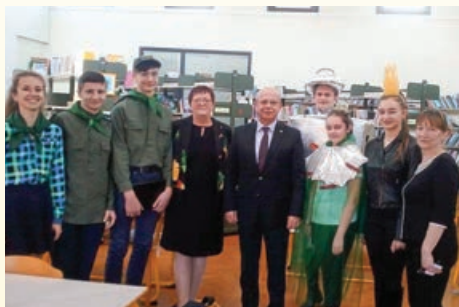
Gostje iz Ukrajine z ambasadorjem gospodom Mykhailom Brodovychom