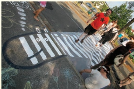
Plakat prve petletke

Grob prikaz našega delovanja smo povzeli v spodnjem plakatu ob peti obletnici in ga pokomentirali na svojem 100. zboru 1. marca letos.