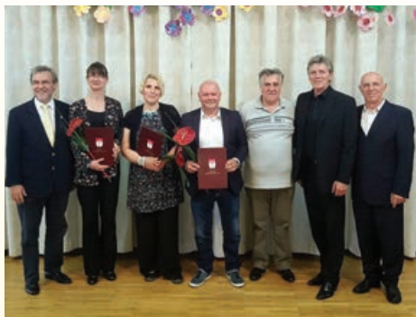
Podelitev priznanj v letu 2016