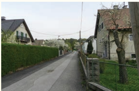
Javna razsvetljava v Ulici Jakoba Župančiča

Komisija za komunalne zadeve je, kot vsako leto, podala svetu MČ Nova vas plan komunalnih aktivnosti, nekatere se pojavljajo v planu že več kot 10 let. Od tako rečeno naših želja je v letu 2017 občina sanirala križišče Betnavske ceste in Knafelčeve ulice, uredila zaporo ulice Na soseki v smeri Betnavske ceste, postavila ogledalo na križišču Livadne in Pengove ulice ter prepleskale so se nekatere stene tržnice Tabor. Največji zalogaj, če temu tako lahko rečemo, je bila izgradnja javne