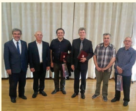
Podelitev priznanj v letu 2017