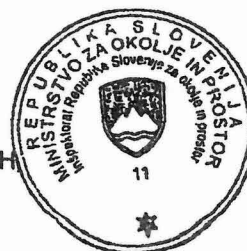
Metoda REBERNAK-LAPUH inšpektorica za okolje