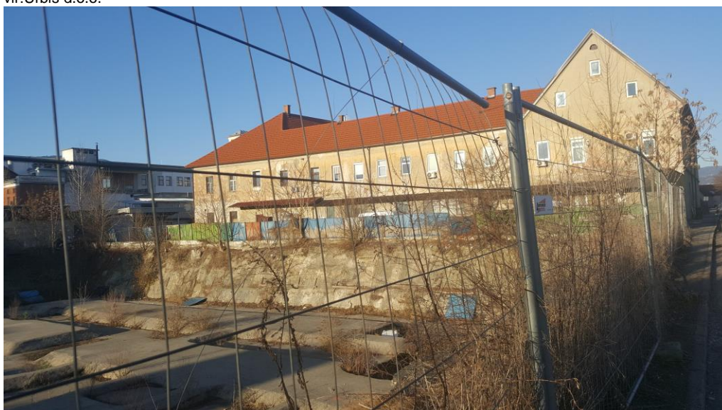
Slika 7: Pogled na obstoječe stanje, proti zahodu