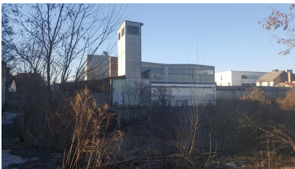
Slika 10: Pogled na obstoječe stanje, pogled proti jugu