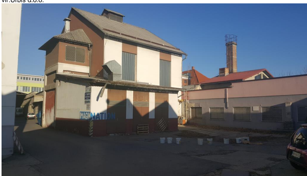
Slika 13: Pogled na obstoječi objekt na južni strani območja