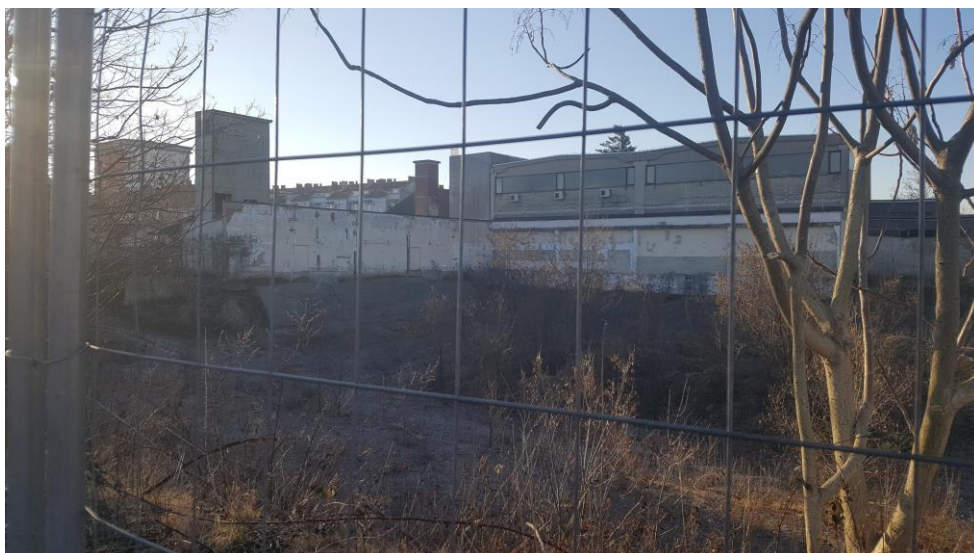
Slika 8: Pogled na obstoječe stanje, proti jugozahodu, robni obstoječi objekti