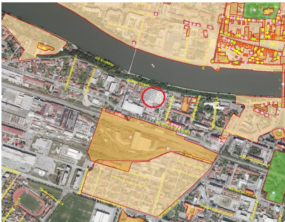
Slika 17: Območje OPPN - rdeč krogec

Obravnava območje leži izven evidentiranih in zavarovanih območij nepremične kulturne dediščine, kar je razvidno iz slike spodaj.