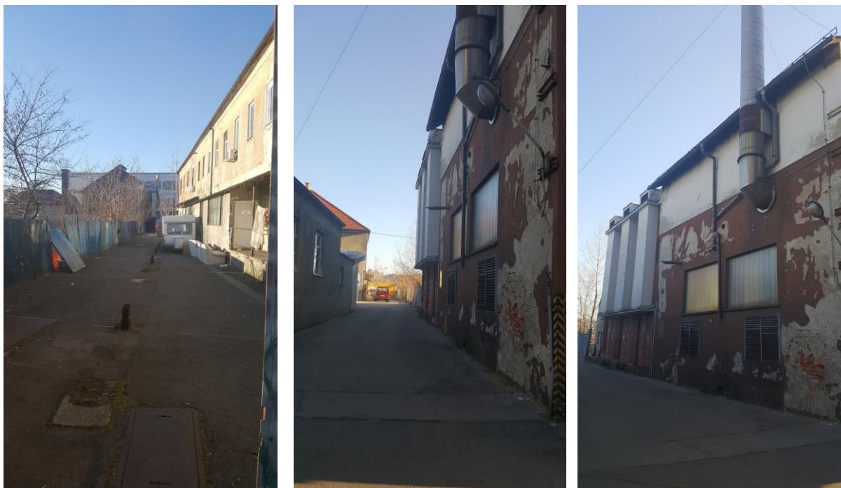
Slika 14, 15,16: Pogled na obstoječe stanje, zahodna meja območja ter pogled proti severu in na obstoječi objekt