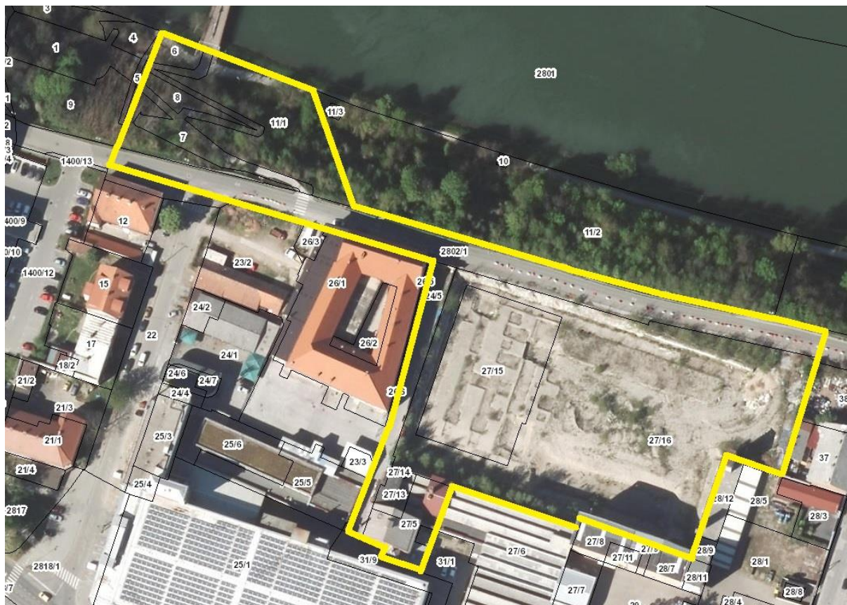
Slika 4: Ožje območje na DOF, vir: ( http://gis.arso.gov.si/atlasokolja/profile.aspx?id=Atlas_Okolja_AXL@Arso )