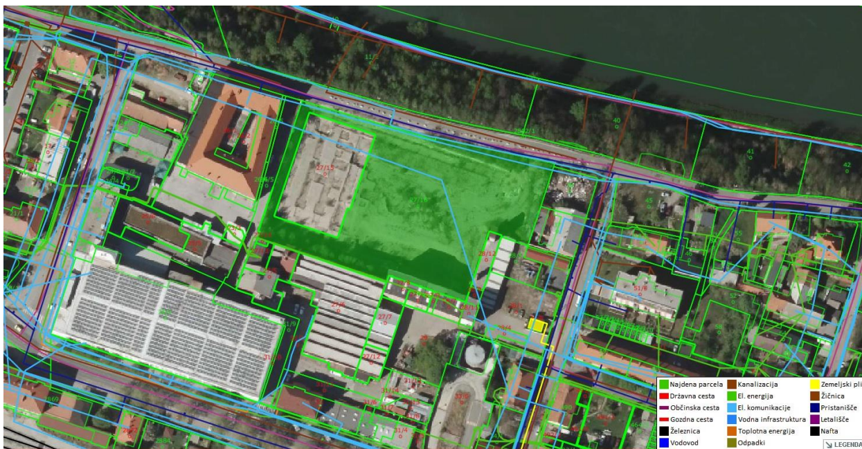
Slika 18: Območje z obstoječi komunalnimi vodi

Obravnava območje se nahaja znotraj strnjene mestne pozidave z vso obstoječo komunalno in energetsko infrastrukturo.