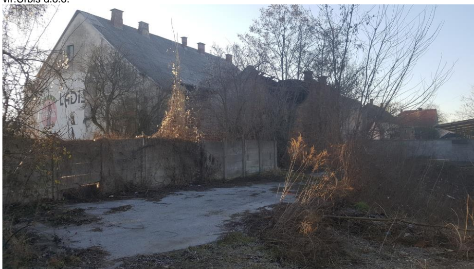
Slika 9: Pogled na obstoječe stanje, vzhodni del, obstoječi objekt izven območja urejanja