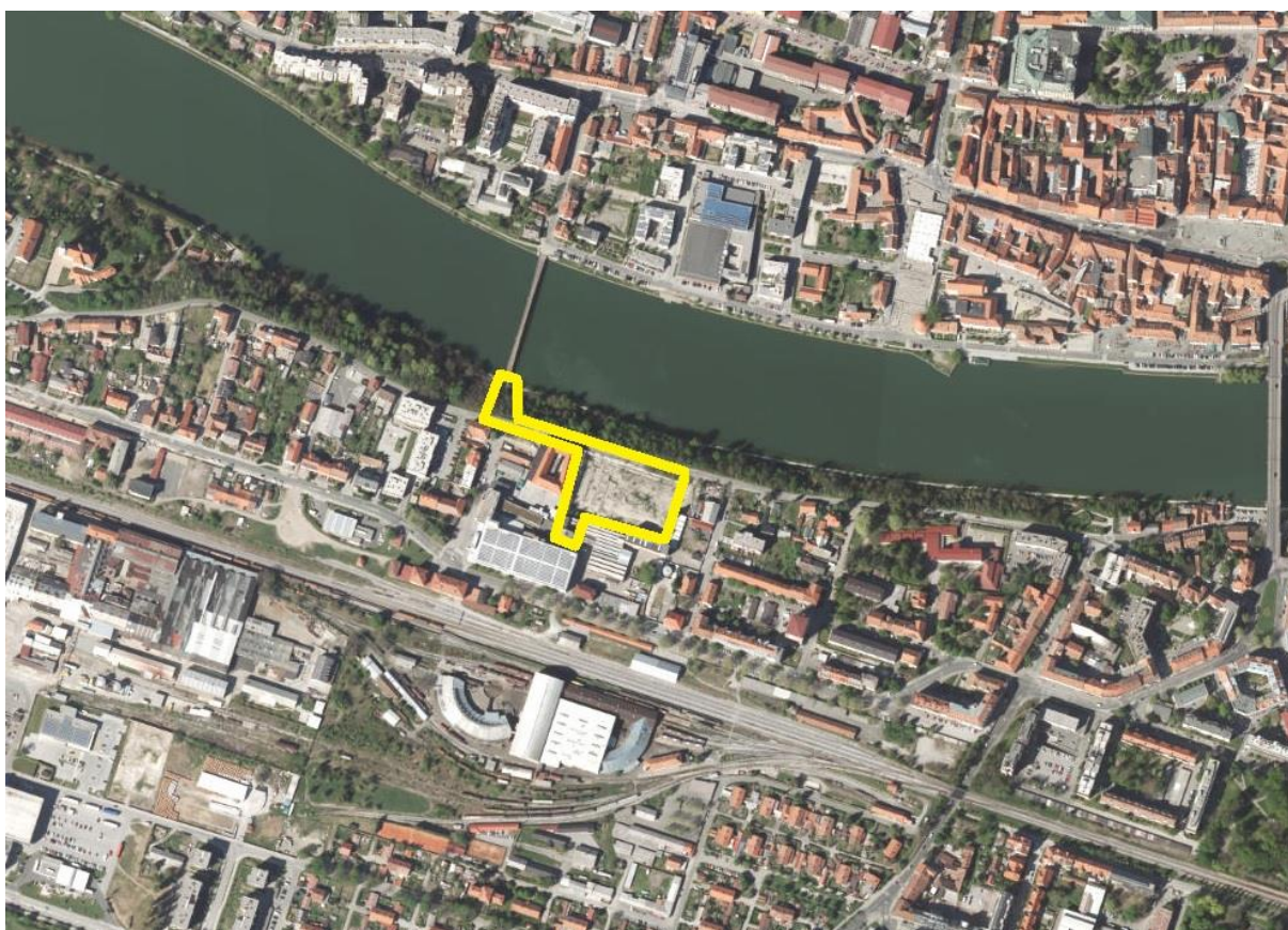
Slika 3: Širše območje na DOF, vir: ( http://gis.arso.gov.si/atlasokolja/profile.aspx?id=Atlas_Okolja_AXL@Arso )

Območje je bilo v preteklosti že namenjeno gradnji objektov – ostala je gradbena jama za kletni del. Je prazno in neaktivno.