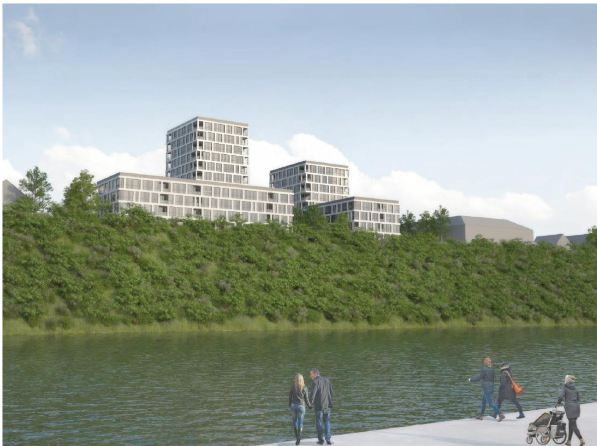
Slika 19, 20, 21: Vizualizacija območja, vir: Studio Kalamar