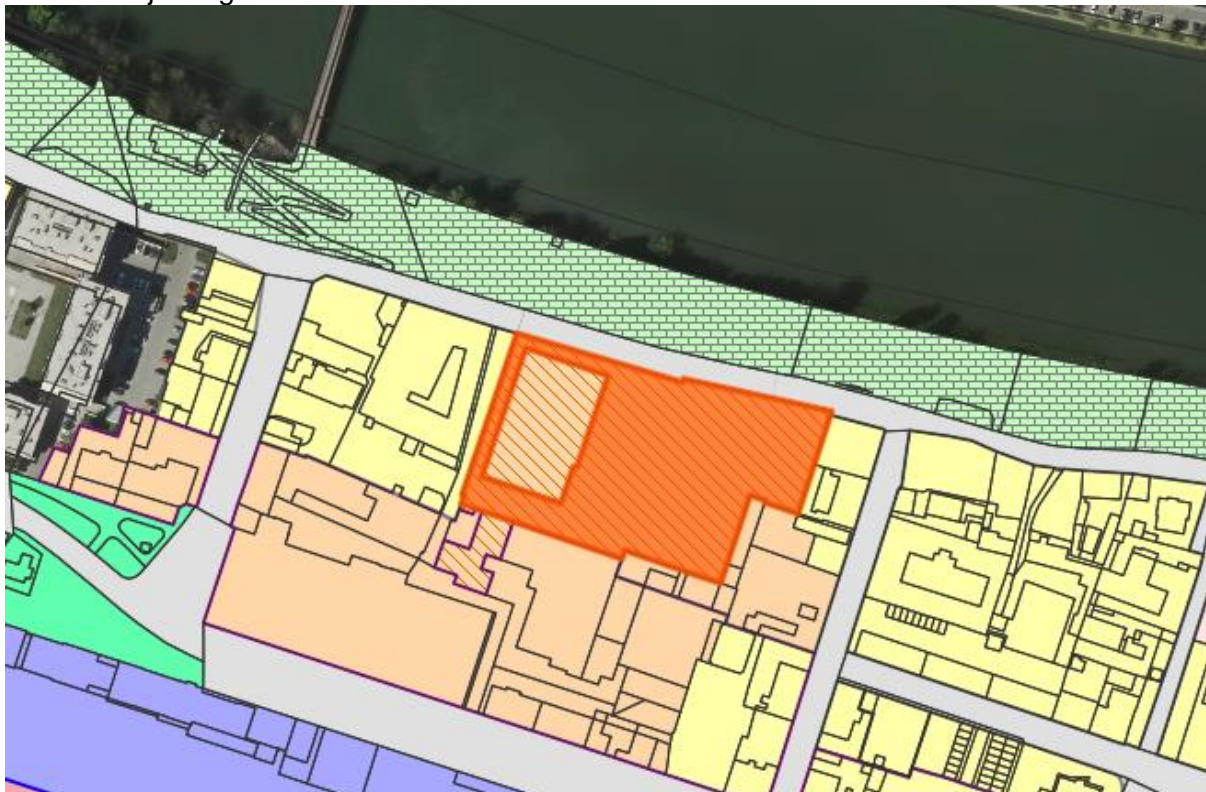
Slika 2: Izsek iz PUP Maribor – namenska raba

Namenska raba površin: površine za stanovanjske in dopolnilne dejavnosti.