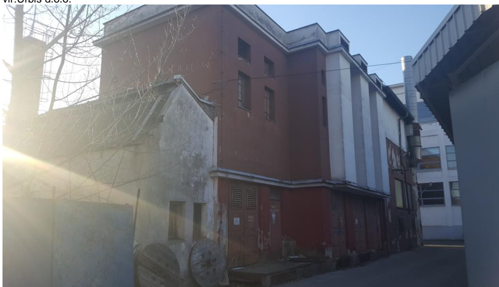
Slika 12: Pogled na obstoječe objekte v skrajnem jugozahodnem delu območja