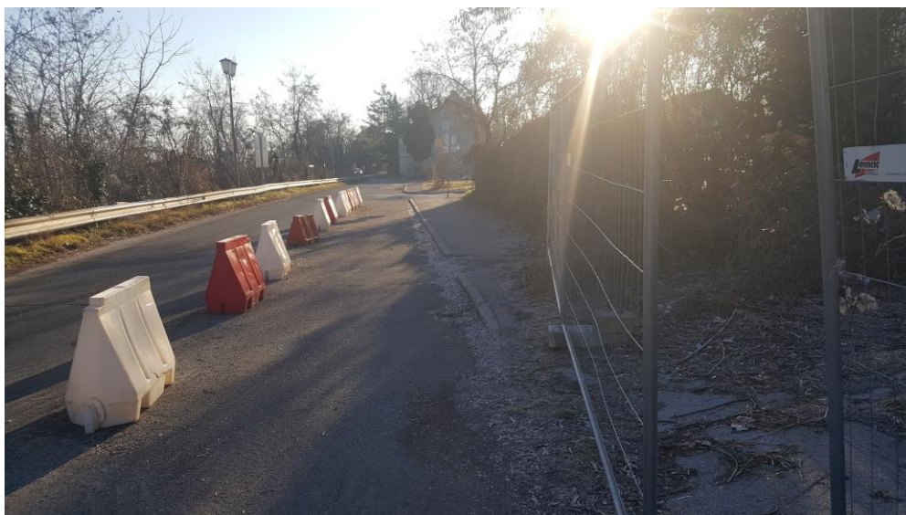
Slika 11: Pogled na obstoječe stanje Ruške ceste, pogled proti vzhodu, skrajni vzhodni del območja