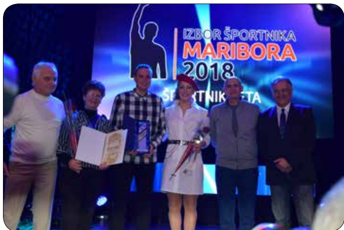
Predstavniki društva gluhih in naglušnih z Ilko Štuhec, športnik leta 2018

29. 1. 2019 je v hotelu Habakuk potekala slavnostna prireditel Športnik leta 2018. V organizaciji Mestne občine Maribor, Urada za šport MOM in Športne zveze Maribor so podelili priznanja najboljšim športnikom v mestu Maribor. O prejemnikih priznanj, ki jih podeljujejo že od leta 1973, so odločali glasovi članov strokovnega sveta Športne zveze Maribor in športnih novinarjev mariborskih medijev. Nagrajeni so bili najuspešnejši športniki posamezniki, klubi, trenerji in drugi športni delavci v mestu.