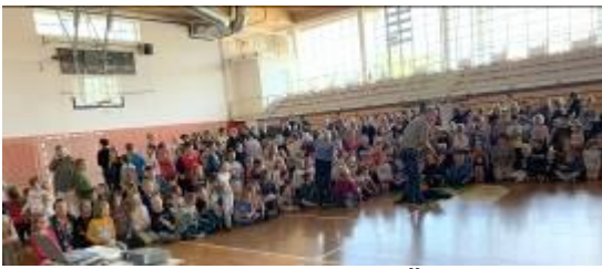
Predstavitve za 450 otrok OŠ Benedikt, oktober 2019

Znatno podporo so prejeli tudi s strani medijev z objavo več člankov in TV prispevkov (Radio City, Utrip Oplotnica, Večer, POP TV, Planet TV, Radio Caprice, revija Paraplegik...). Spremljali so aktivnosti ob mednarodnem dnevu psov vodnikov, mednarodnem dnevu bele palice, mednarodnem dnevu invalidov. Izdali so koledar 2020 in imeli foto razstavo na temo Šapice z razlogom v UKC Maribor-pediatrija, fotografa Darka Novaka.