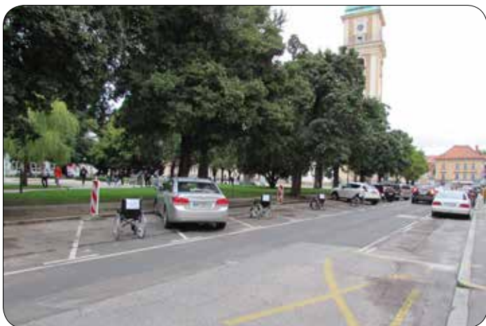
Dan mobilnosti invalidov 2019 – akcija Pridem takoj

Sočasno je potekal tudi inkluzijski sprehod med zanimivimi drevesi v Mestnem parku, ki je bil izveden v organizaciji in sodelovanju Planinskega društva Maribor Matica in Hortikulturnega društva Maribor. Udeležilo se ga je okoli 60 oseb. Sočasno so se kolesarji v spremstvu in pod vodstvom predstavnikov Mariborske kolesarske mreže udeležili 10 km dolge krožne vožnje po Mariboru. Kolesarji so uporabljali različna kolesa, od navadnih do prilagojenih. Vsi sodelujoči na sprehodu in na kolesarski turi so bili zelo zadovoljni z izvedbo aktivnosti in si želijo več podobnih dogodkov.