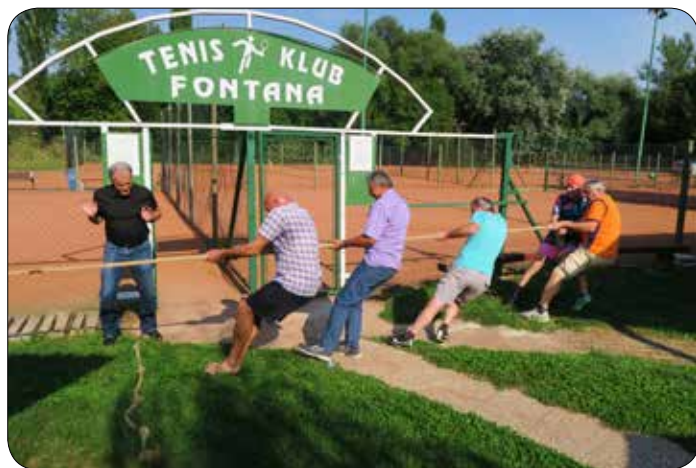
Vlečenje vrvi na Športno-rekreativnem srečanju invalidov 2019

Našemu vabilu so se odzvali tudi mediji, ki so pozitivno poročali o športno-rekreativnem srečanju invalidov. Vabim vas, da si ogledate prispevka RTV SLO in NetTV.