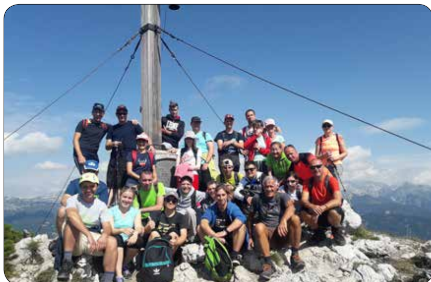
Leseni križ na Voglu

bitja so skulpture (stolpiči), sestavljene iz kamnov različnih velikosti. Kamen na kamen – možicelj. Običajno jih popotniki postavljajo na pomembnih križiščih kot markacije, da se ne zgubijo. Kot kažipote so jih uporabljale že stare kulture od Andov do Tibeta. A v tem primeru je šlo za pravo množično zborovanje, kot da bi si imeli toliko za povedati. In na vrhu so morali nekaj povedati predvsem tisti, ki v življenju še niso stali na višji točki. Za njih je sledil krst – s pohodno palico po riti. Tako, malo po dolgem in malo počez.