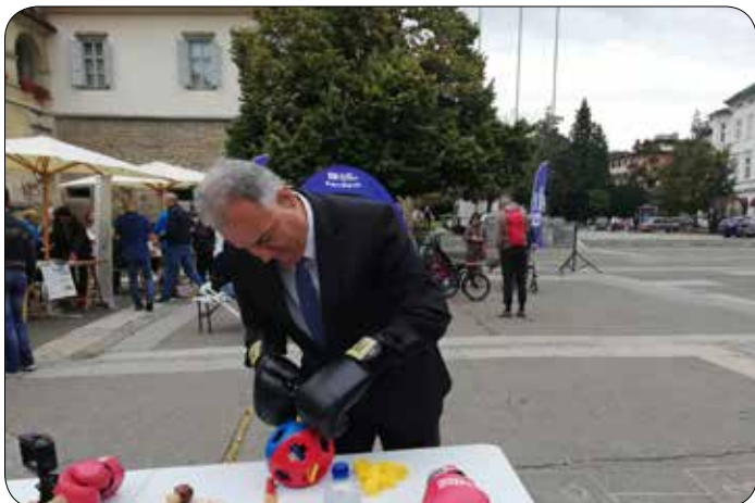
Dan mobilnosti invalidov 2019 – dogajanje na Trgu svobode

Sočasno je potekal tudi inkluzijski sprehod med zanimivimi drevesi v Mestnem parku, ki je bil izveden v organizaciji in sodelovanju Planinskega društva Maribor Matica in Hortikulturnega društva Maribor. Udeležilo se ga je okoli 60 oseb. Sočasno so se kolesarji v spremstvu in pod vodstvom predstavnikov Mariborske kolesarske mreže udeležili 10 km dolge krožne vožnje po Mariboru. Kolesarji so uporabljali različna kolesa, od navadnih do prilagojenih. Vsi sodelujoči na sprehodu in na kolesarski turi so bili zelo zadovoljni z izvedbo aktivnosti in si želijo več podobnih dogodkov.