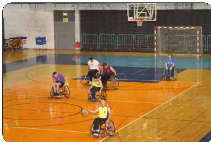
Športne igre invalidov 2019 – Košarka na vozičku

Svet invalidov Mestne občine Maribor je v soboto, 11. 5. 2019, priredil jubilejne, 10. Športne igre invalidov Maribora. Športne igre invalidov so potekale v okviru Športne pomladi 2019 na prizoriščih Športnega parka Tabor Maribor. Letos se je iger udeležilo rekordnih 550 udeležencev. Vsi tekmovalci, nastopajoči v kulturnem programu in prostovoljci so prejeli spominske majice.