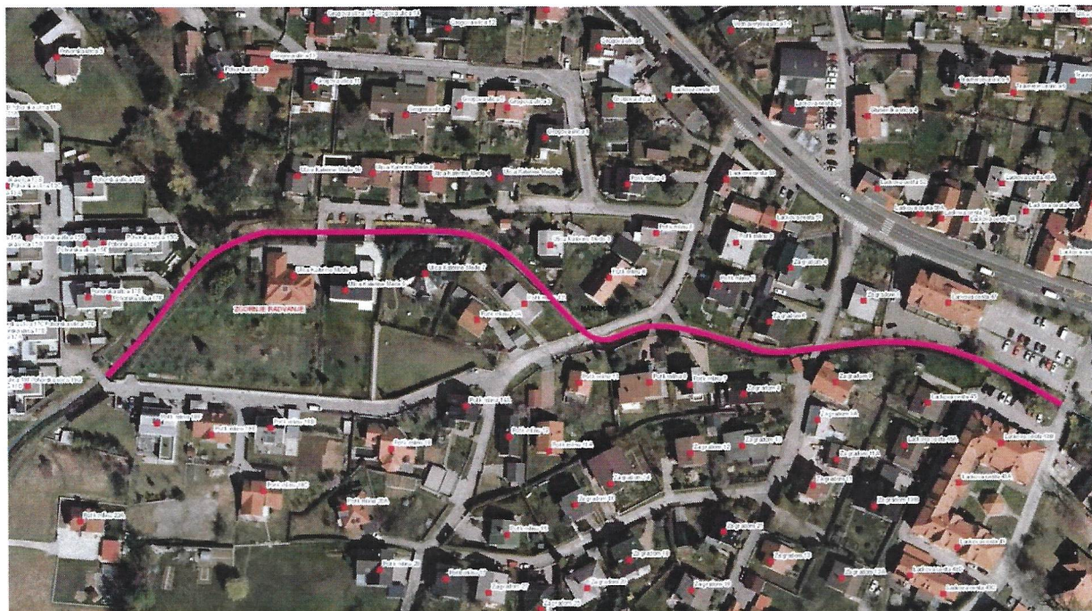
Slika 2: Mikrolokacija

Na obravnavanem odseku Radvanjskega potoka, ki se nahaja med mostom ob h. št. Lackova c. 43b in mostom ob h. št. Pohorska ul. 17d, se je v preteklosti posegalo v priobalno zemljišče in sicer postavile so se ograje, zasadile žive meje in okrasna vegetacija.