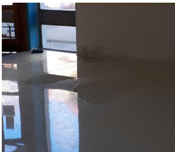
Slika 7: Prikaz kondenzacije v garderobnih prostorih