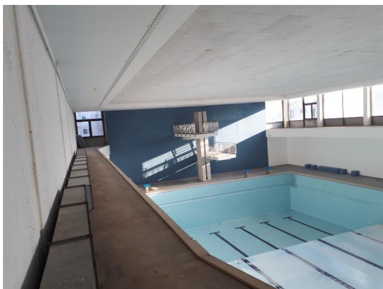
Slika 2: Pogled na srednji bazen