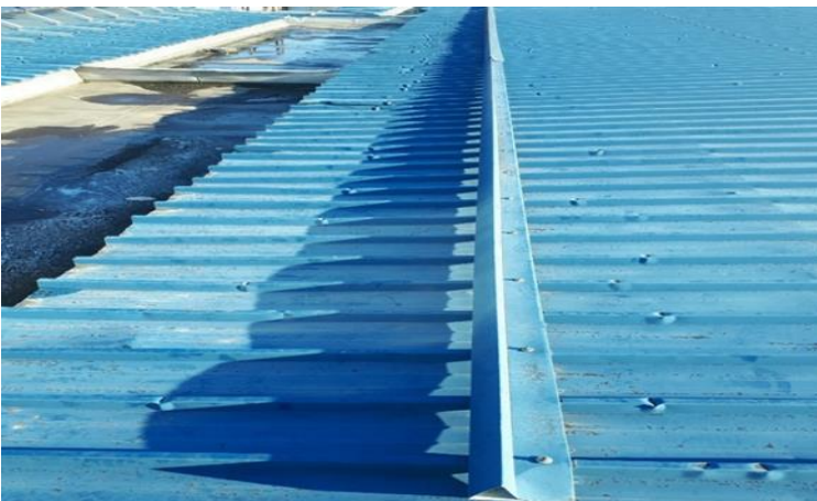
Slika 11: Streha