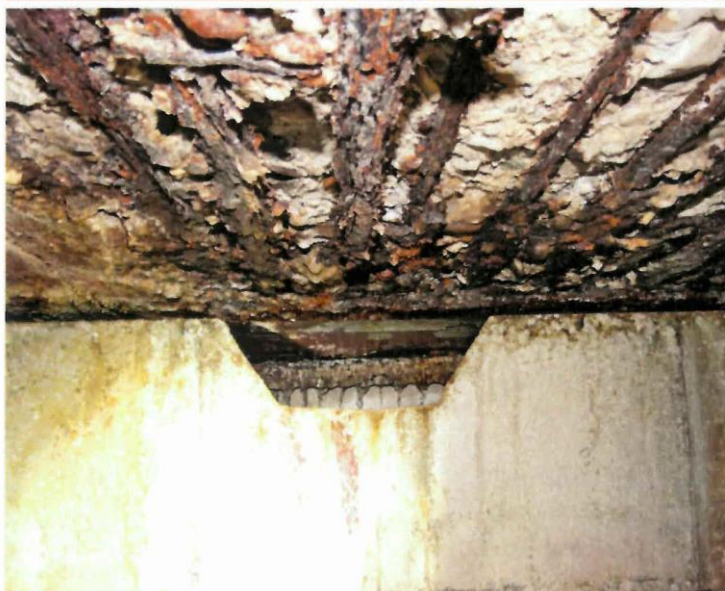
Slika št.8: Razpadanje betona in močna korozija armature plošče ob stiku z bazenom v predelu prostora s stebrom skakalnice – detajl 2 (vogalni del prostora HV).

Na konstrukciji 25 metrskega bazena se je zaradi nepravilne izvedbe prelivnega kanala pokazala močna dotrajanost in korozija primarne konstrukcije. Leta 2013 je Svet zavoda Športni objekti MB, ki je upravljavec kompleksa Pristan, prejel sklep o obveznem strokovnem ogledu in pregledu konstrukcije bazenske ploščadi kot tudi samega bazena. ZAG (Zavod za gradbeništvo) je opravil temeljit strokovni ogled z odvzemom vzorcev konstrukcije 22.1.2014. Ugotavljajo, da je prisotno tudi premakanje spodnje plošče bazena in s tem predvidevajo, da so se korozijski procesi armature pričeli tudi na določenih predelih zgornje armature talne plošče ter armature na notranji površini armiranobetonske školjke bazena. Potrebno je tudi ugotoviti vzrok za dotekanje vode v prostor med betonsko školjko in aluminijasto konstrukcijo bazena ter posledično premakanje betonske plošče školjke bazena. Zato je dolgoročno gledano najbolj smiselna zamenjava celotne konstrukcije bazena s pripadajočimi inštalacijami ter ustrezna rekonstrukcija kletnih prostorov okoli bazena, ki bo omogočila nemoteno spremljanje stanja bodoče konstrukcije.