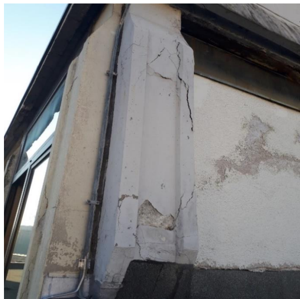
Slika 9: Zunanji stebri