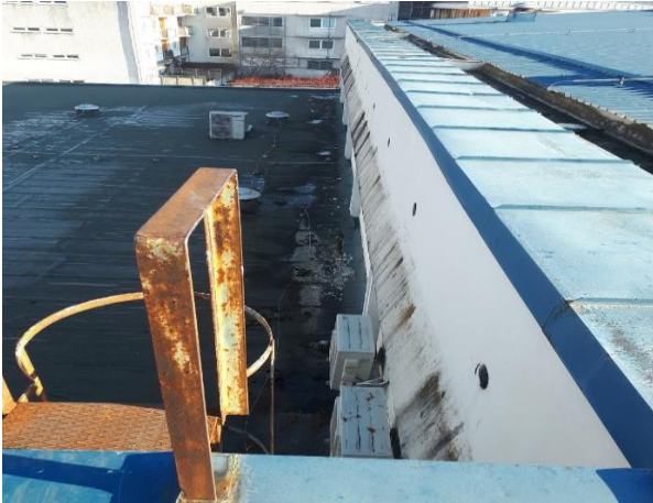
Slika 10: Streha - predvidena postavitve klimatov