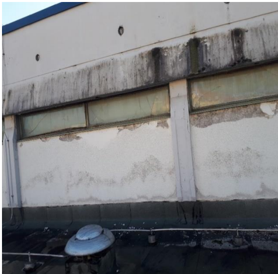
Slika 8: Zunanji stebri