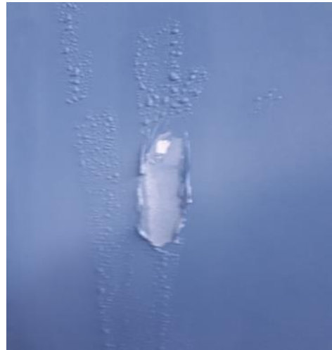
Slika 4: Vzhodna stena ob skakalnici v srednji bazen