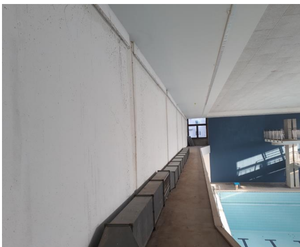
Slika 6: Prikaz kondenzacije-plesni v garderobnih prostorih