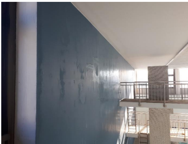
Slika 5: Vzhodna stena ob skakalnici v srednji bazen