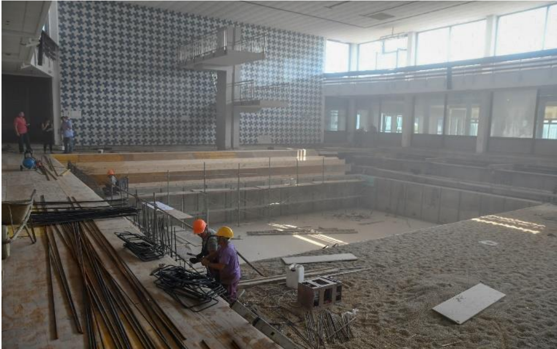
Slika 3: Sanacija srednjega bazena