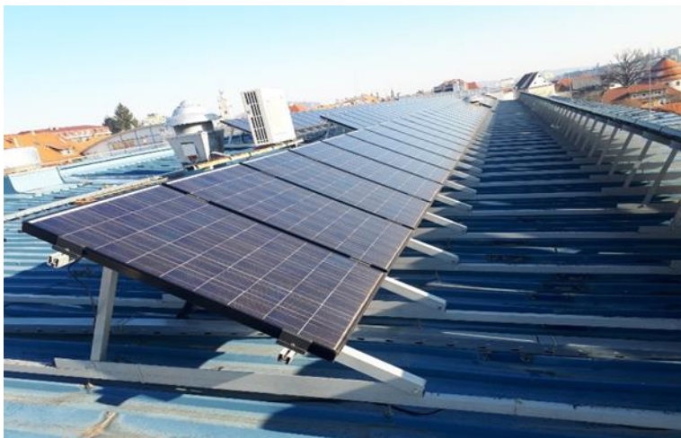
Slika 12: Streha s fotovoltaiko