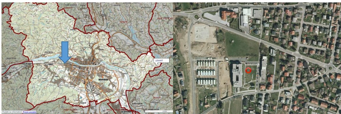
Slika 1: Prikaz območja SD OPPN v širšem in ožjem prostoru

Izven območja SD OPPN ni predvidena ureditev energetske, komunalne ali telekomunikacijske infrastrukture.