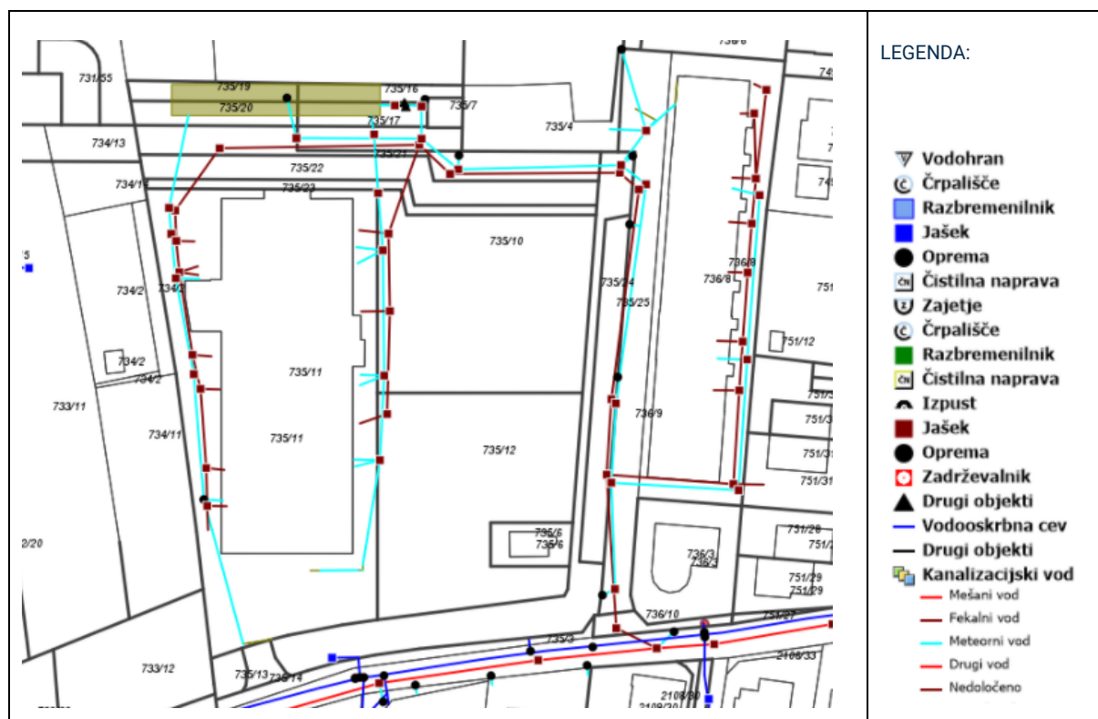
Slika 4: Obstoječe stanje kanalizacijskega omrežja

Obstoječe omrežje za odvajanje in čiščenje odpadnih vod (mešan sistem) potekata v južnem delu predmetnega območja. Meteorna in fekalna kanalizacija potekata na vzhodnem, severnem in zahodnem delu objekta.