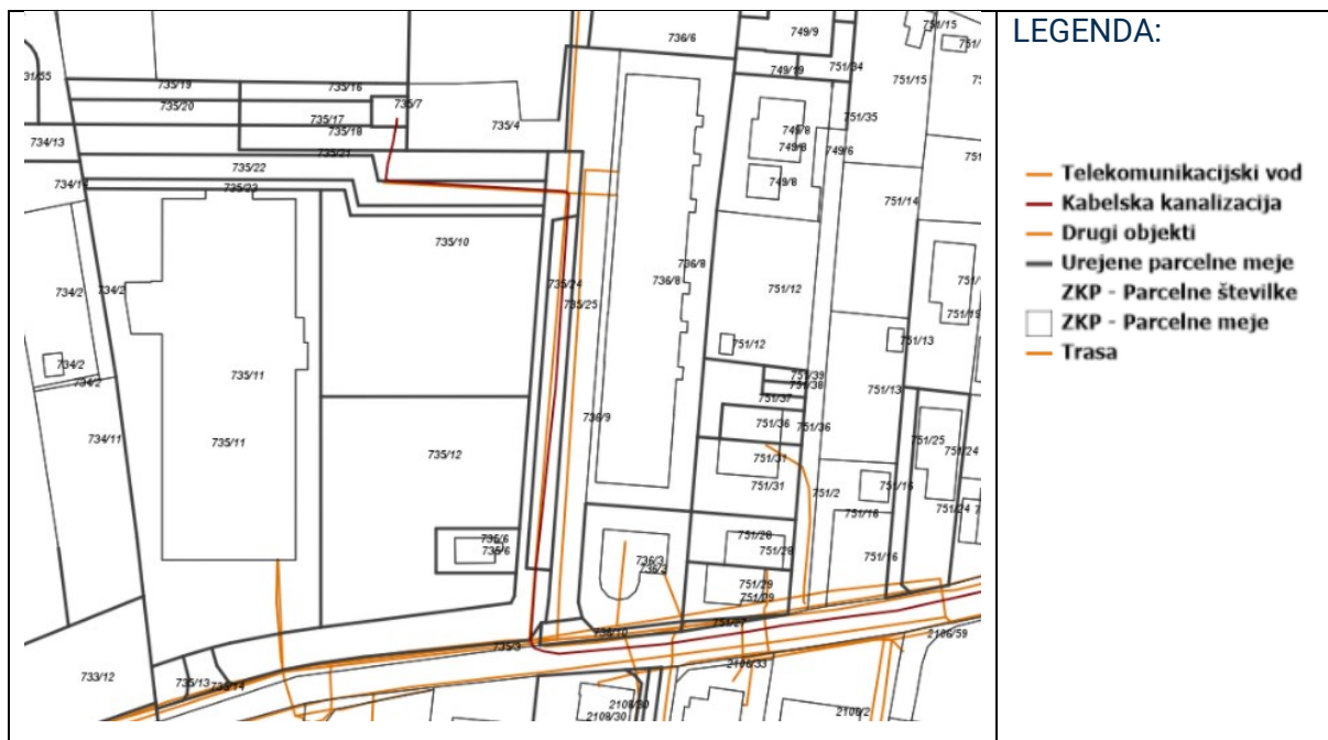
Slika 6: Obstoječe stanje kanalizacijskega omrežja

Glede na podatke zbirnega katastra gospodarske javne infrastrukture, je za nameravano ureditev zagotovljena potrebna navezava na obstoječa infrastrukturna omrežja. Gospodarska javna infrastruktura je speljana na območje sprememb in dopolnitev