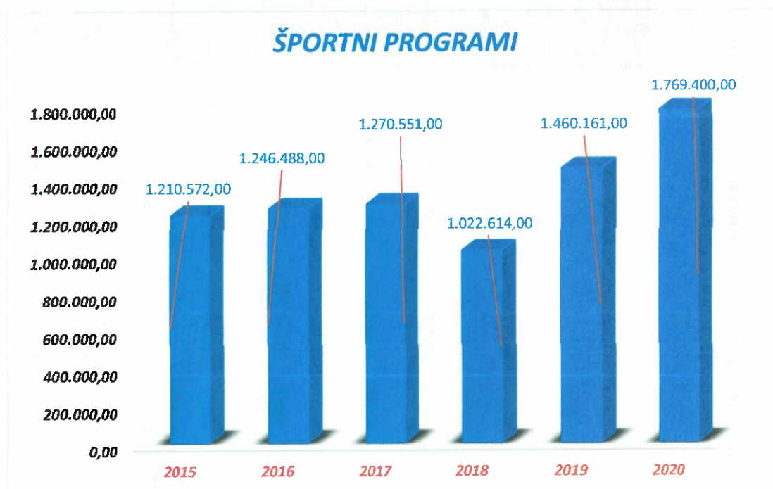
Grafikon 1: Poraba sredstev za izvajanje LPŠ v MOM za športne programe