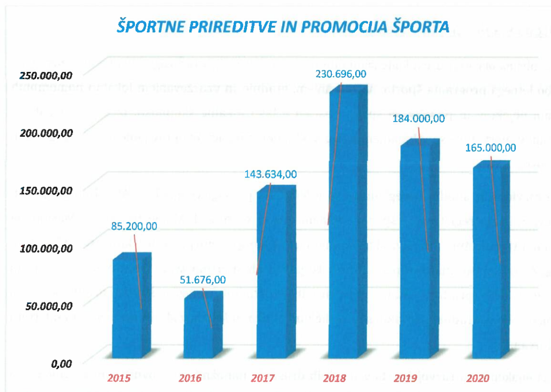
Grafikon 3: Poraba sredstev za izvajanje LPŠ v MOM za športne prireditve in promocijo športa