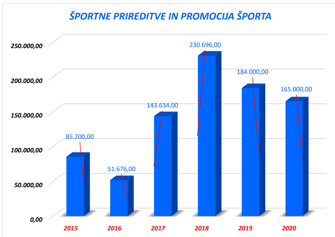
Grafikon 3: Poraba sredstev za izvajanje LPŠ v MOM za športne prireditve in promocijo športa