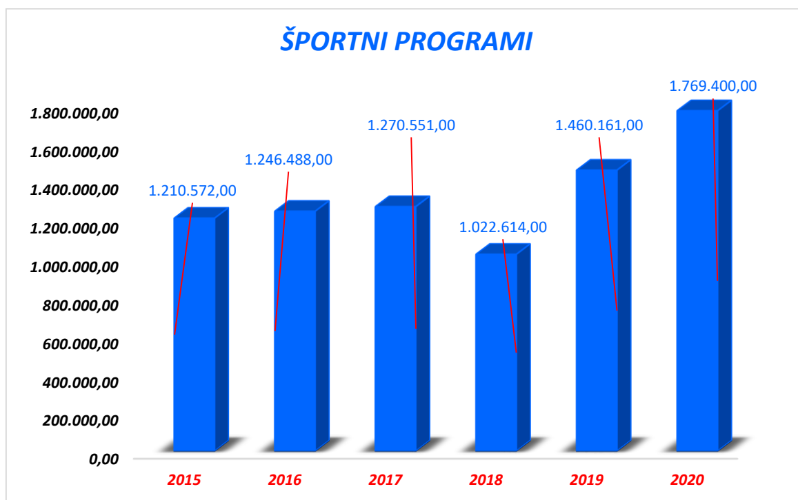
Grafikon 1: Poraba sredstev za izvajanje LPŠ v MOM za športne programe