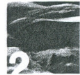
Center za upravljanje in vzdrževanje kanalizacijskega omrežja