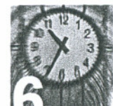
Center za gospodarjenje z avtobusno postajo Maribor

Za realizacijo vaše zahteve po dostavi dokumentacije vam predlagamo da pred pričetkom izvedbe pregledamo videoposnetek stanja kanala ter računalniški izpis stanja kanala ter sprejmemo odločitev o obsegu sanacije.