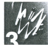
Center za gospodarjenje z javno razsvetlavo in prometno signalizacijo