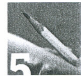
Center za tržne storitve