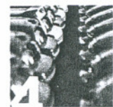
Center za gospodarjenje z javnimi parkirišči